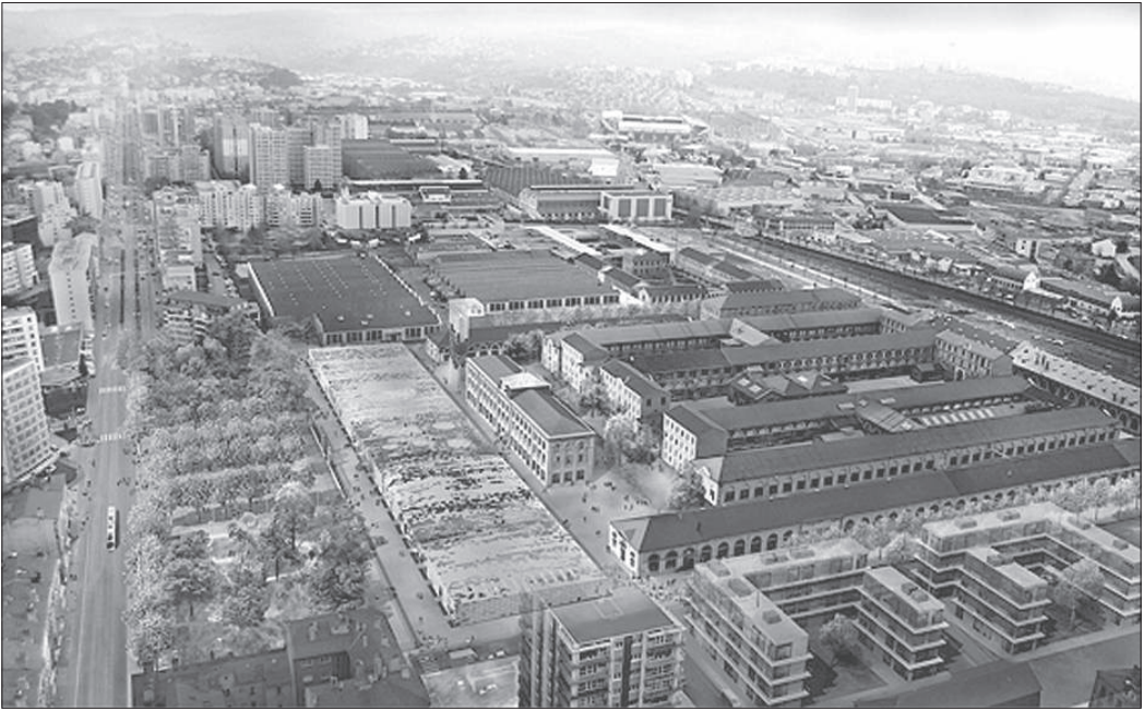
Photo 1 : Vue aérienne prospective de la Cité du Design et de la Manufacture Forward-looking aerial view of the city of the design and the weapons factory

comme une « ville noire » (Vant, 1981). Le pari que s'est donc vu proposer le lauréat du concours est celui de l'instauration d'un dialogue architectural entre les bâtiments de la manufacture présents sur le site et ceux de la future Cité du Design, dans le cadre d'une « symbiose imposée où il est escompté que l'intérêt suscité par l'œuvre du présent se répercute sur l'œuvre ancienne, annonçant ainsi une dialectique » (Choay, 1992). La priorité reste toutefois la composition d'un ouvrage représentatif de la nouvelle modernité stéphanoise, étendard du retournement d'image d'une ville qui ambitionne de devenir une des capitales mondiales du design. En s'installant sur le site de la MAS (fig. 1), ce projet soulève la question de la relation entre passé et modernité ; entre le patrimoine, sa conservation, et la création architecturale contemporaine dans un contexte de renouvellement urbain. Le projet architectural de la Cité du design permet ainsi d'aborder l'enjeu mémoriel inhérent à toute opération d'aménagement, et renseigne plus largement sur le rapport qu'entretient la société stéphanoise, à travers ses élus, vis-à-vis de son passé.