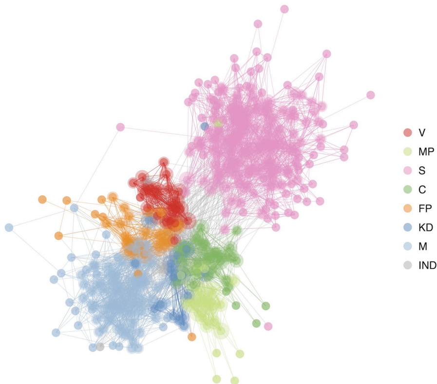
Figure 2. Réseau des cosignatures législatives du parlement suédois au cours des années 1994-1998. Graphe basé sur 9,869 propositions de loi et 398 parlementaires. Les abréviations renvoient à l'affiliation partisane 20 .

Il est intéressant d'observer que, dans la mesure où une large partie des parlementaires participe à la (co)signature des propositions de loi, la composition sociodémographique et politique des réseaux de cosignatures renseigne indirectement sur la composition des assemblées législatives. Les réseaux des parlements nordiques, par exemple, sont les plus féminisés, avec un pourcentage de femmes allant de 27% à 47% ; inversement, les réseaux des parlements est-européens ne contiennent qu'entre 2% et 25% de femmes. De la même manière, dans les réseaux correspondant aux législatures 8 à 14 (années 1988 à 2014) de l'Assemblée nationale française, l'âge médian des députés varie de 51 à 56 ans, des valeurs très proches de celles observées sur la même période par une analyse quasi-