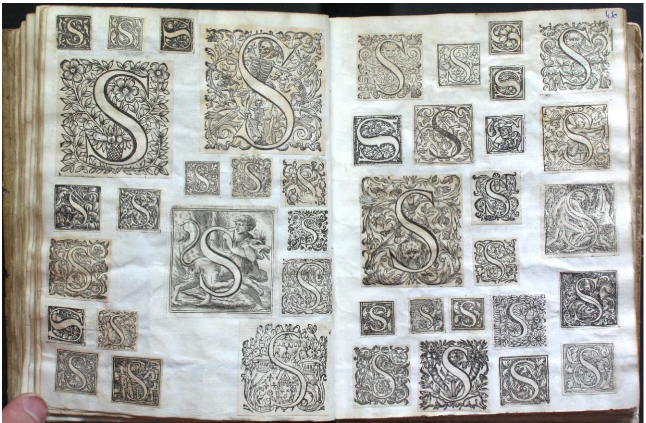
Fig. 3. Album d'ornements, début XIX e s. (Paris, École Estienne, I 1741)