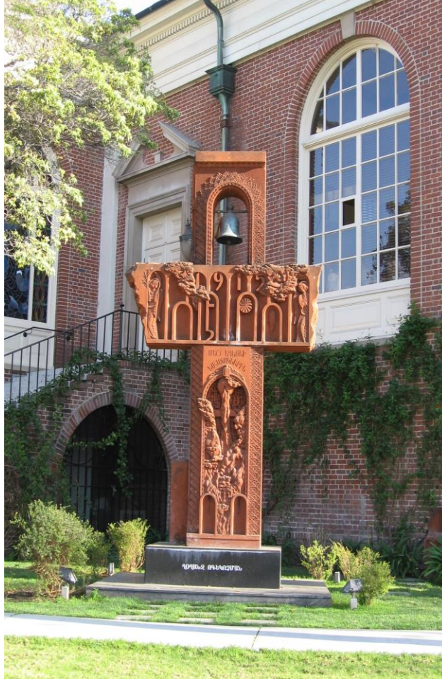
Photographie 1 Croix de pierre ( khatchkar ) devant l'église Sainte Marie à Glendale, vue du côté nord, avenue Central, commandée et importée d'Arménie, inaugurée en 2002.

Ces croix reprennent les éléments figuratifs et les canons de sculpture des croix anciennes qui parsèment les territoires arméniens d'Arménie actuelle et de l'ancien Empire Ottoman.