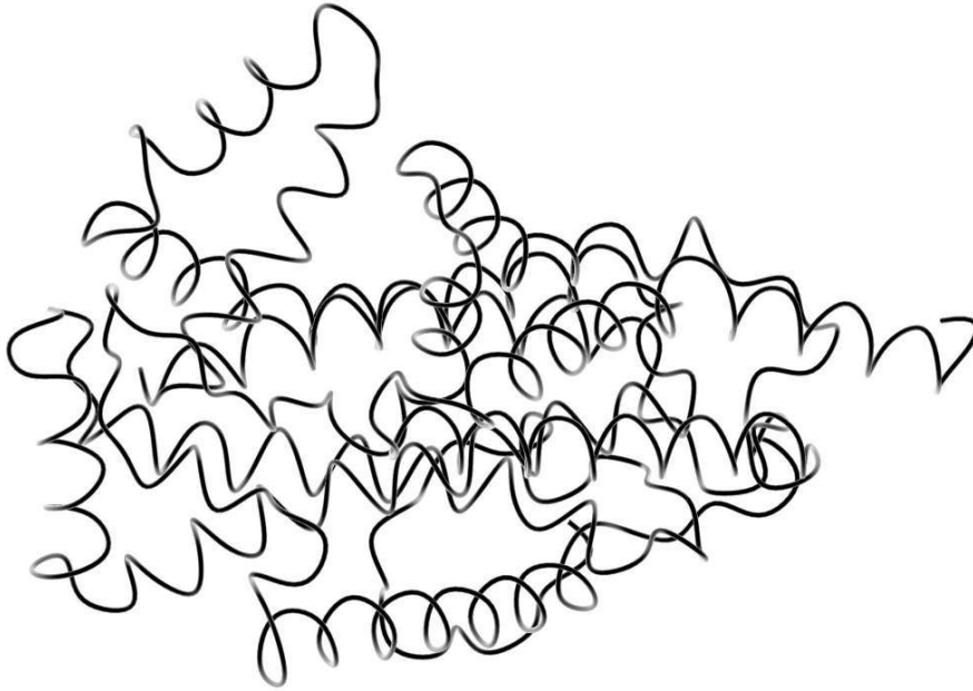
Ill. 1 : Un phoenix post-génomique : structure modélisée d'une protéine préhistorique, le cytochrome b de l'aurochs ( Bos primigenius ). Ce modèle de structure a été obtenu en utilisant le serveur HHPred et à partir de la séquence protéique récupérée dans GenBank.

actualisés à un moment donné et que cette trace de l'actualisation de leur présence soit lue dans les génomes déposés dans les bases de données (Ill. 1).