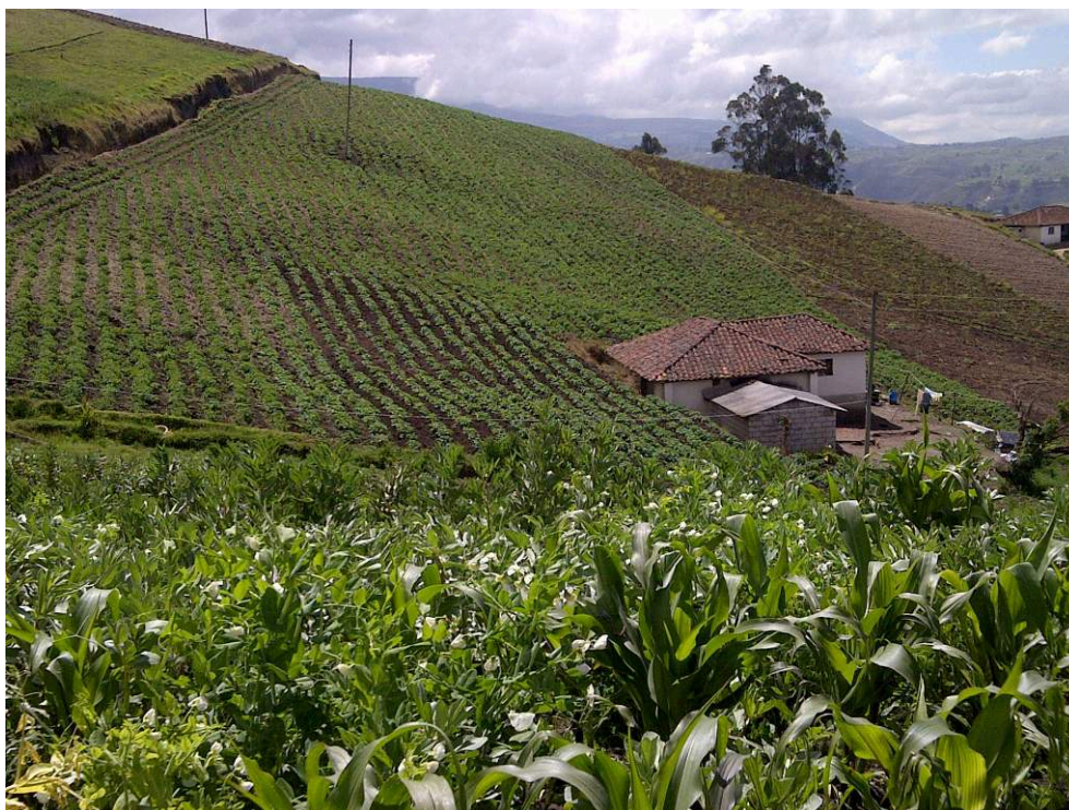
Figure 2. Paysage agraire dans la partie orientale du canton de Salcedo en 2015

Dans les exploitations familiales de la partie orientale du canton de Salcedo, les parcelles de pomme de terre peuvent occuper des superficies importantes.