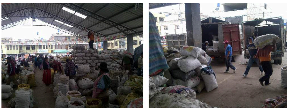
Figure 3. La foire de Salcedo en 2015

Chaque jeudi et chaque samedi, des centaines de producteurs de pommes de terre se retrouvent à la foire de Salcedo où les attendent des commerçants venus des plus grandes villes équatoriennes.