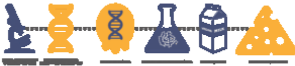
Schéma expliquant le développement du Real Vegan Cheese.

Real Vegan Cheese est un projet de biologie de synthèse de deux laboratoires communautaires de la baie de San Francisco : Counter Culture Labs à Oakland et Biocurious à Sunnyvale en Californie. Le but de Real Vegan Cheese est de modifier génétiquement des levures pour produire des protéines de lait, afin de créer un fromage synthétique avec les propriétés physiques et phénoménologiques d'un fromage ordinaire (voir image 2). Le projet répond à des préoccupations environnementales (liées au caractère non-durable de l'élevage animal) et éthiques (concernant le traitement des animaux). Il reflète aussi le désir de trouver un projet qui puisse être présenté au concours iGEM. Ce concours, rappelons-le, a joué un rôle clé dans l'établissement de la biologie de synthèse à la fois comme discipline académique et comme lieu pour des investissements privés. Le projet a débuté au printemps 2014 et a accéléré dans les mois qui ont précédé l' iGEM Jamboree en octobre 2014.