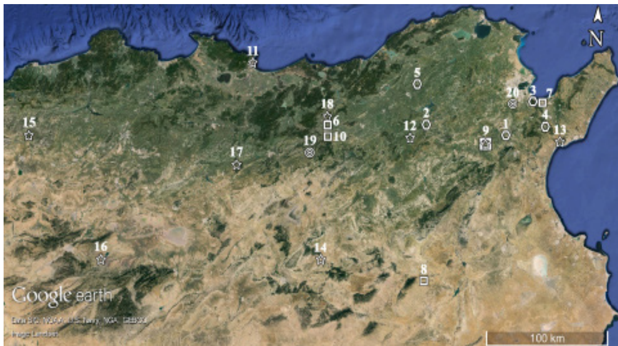
FIG. 2 : Les types architecturaux de sanctuaires de Saturne reconnus par M. Le Glay. L' area sacra à ciel ouvert (pentagone) : 1, Aïn el-Djour ; 2, Aïn Tounga ; 3, Bou Qournein ; 4, Tubernuc ; 5, Hr el-Faouar (?). Le sanctuaire rural à plan simplifié (carré) : 6, Bir Derbal ; 7, Bordj Cedria ; 8, Hr es-Srira ; 9, Thuburbo Maius ; 10, Sidi Mohamed el-Azreg (?). Les temples dits africains ou romano-africains : 11, Annaba ; 12, Dougga ; 13, Thinissut ; 9, Thuburbo Maius ; 14, Ammaedara ; 15, Cuicul ; 16, Thamugadi ; 17, Thubursicu Numidarum ; 18, Thuburnica . Le temple à plan circulaire : 19, Ksiba (?); 20, Mohammedia. Carte élaborée par B. D'Andrea (Google Earth © Image Landsat).

Les aires sacrées à ciel ouvert et les sanctuaires ruraux à plan simplifié se différencient des tophets par l'absence d'urnes cinéraires, par les inscriptions votives, qui sont toujours en caractère et langue latine et, dans une moindre mesure, par la forme et l'iconographie des stèles 52 . Le modèle de référence est sans doute celui des tophets, cependant les sanctuaires de Saturne de type simplifié et les tophets ne sont jamais attestés dans la même ville ou dans la même région, comme s'ils ne se trouvaient pas en continuité l'un de l'autre mais en concurrence.