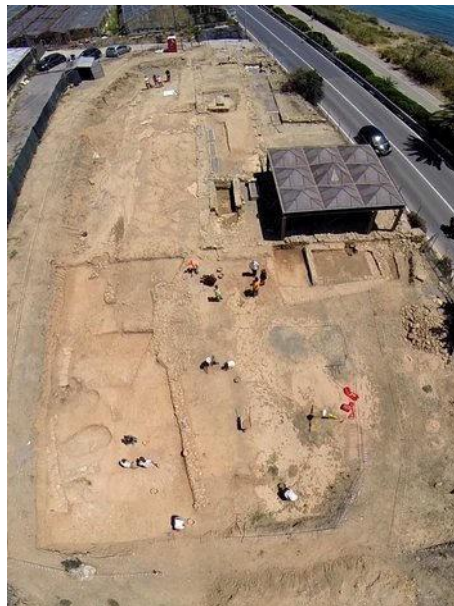
Fig. 2. Panoramica del sito di Capo Don, foto da drone

Il sito si trova su una fascia costiera pianeggiante la cui ampiezza in antico non è facile oggi da calcolare: l'attuale linea di costa infatti è più ampia di quella antica, frutto delle sistemazioni in occasione della realizzazione della ferrovia alla fine dell'800. E' probabile che la piana di Capo Don in origine fosse larga un centinaio di metri, oltre i quali progressivamente risaliva di quota per altri 200 metri verso nord, fino ad incontrare la parete dell'altura di Monte Grange.