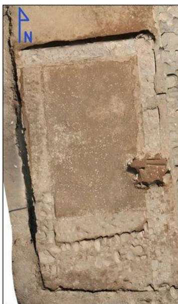
Fig. 6. Scavo di Capo Don, ambiente F: ortofoto

di scavo, preservato per le future indagini archeologiche. Ad una prima analisi preliminare, si tratta di tessere grigiastre, di colore piuttosto chiaro, abbastanza grandi.