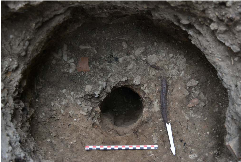
Fig. 5 - Détail du tour avec les fragments de vases crus.