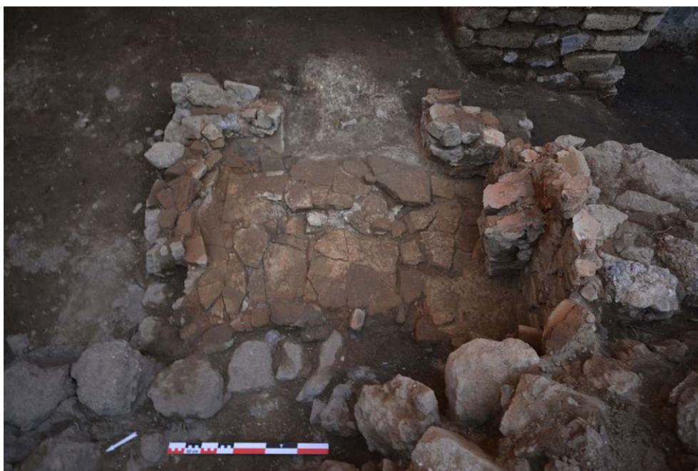
Fig. 8 - Photo du four FR30008 situé dans la pièce 30-2.