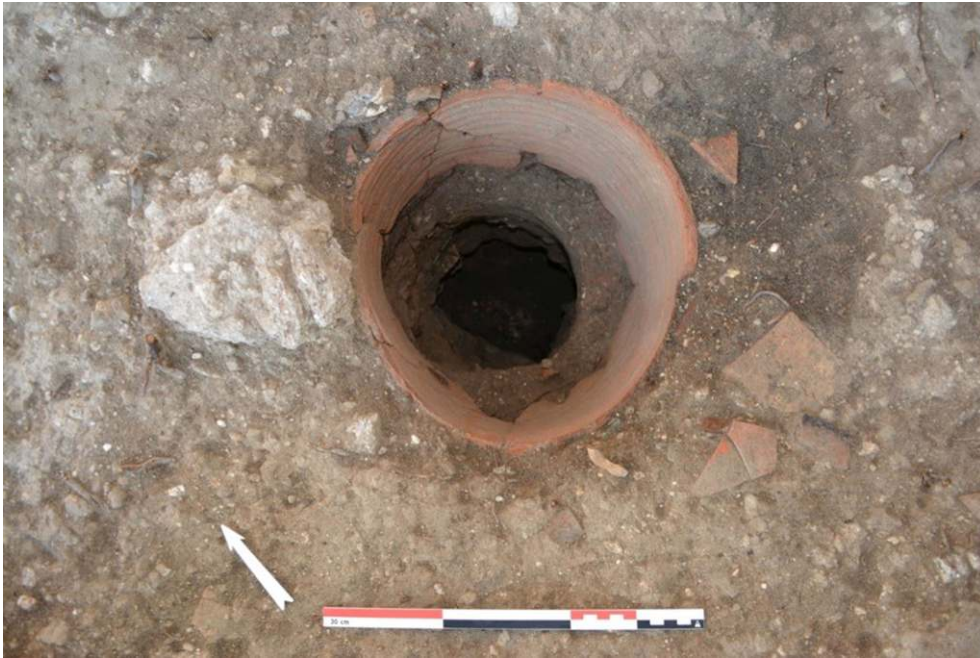
Fig. 6 - Photo zénithale du 2 e type de tour.