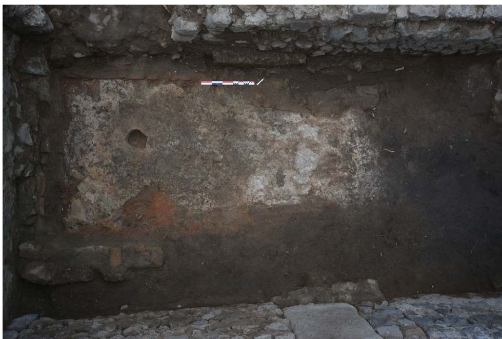
Fig. 9 - Photo zénithale du four FR30018 situé dans la pièce 30-1.