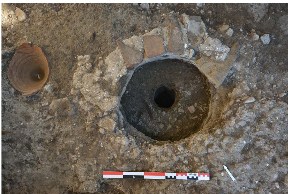
Fig. 4 - Photo zénithale du tour SB28028.