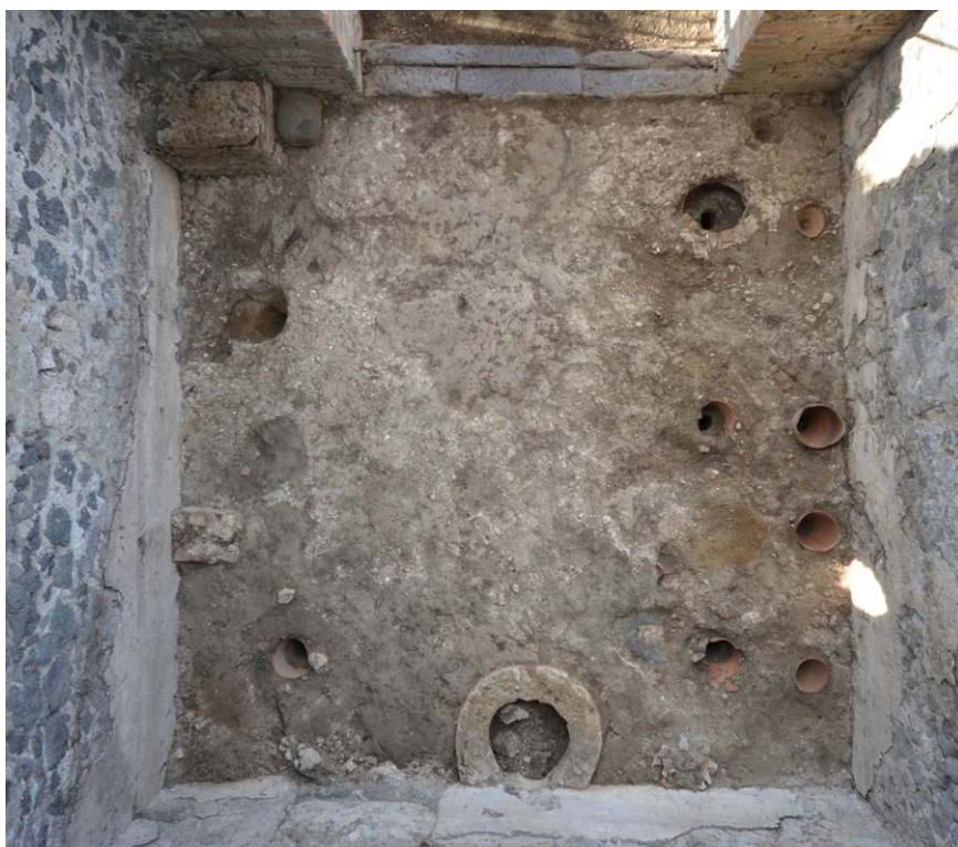
Fig. 3 - Photo zénithale de la pièce 28-1 après enlèvement des niveaux modernes.