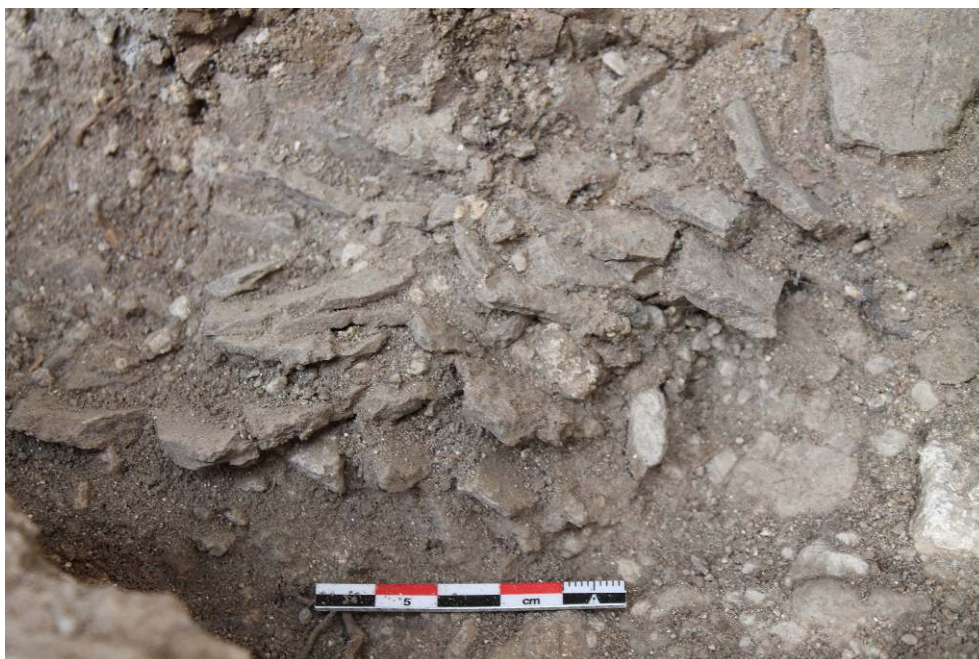
Fig. 7 - Photo de détail des vases crus en phase de séchage mis au jour dans l'angle nord-est de la pièce 28-1.