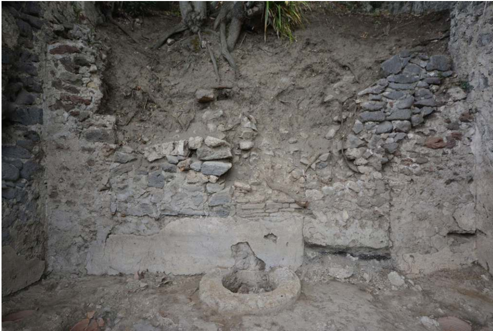
Fig. 2 - Bouchage de la pièce 28-2.