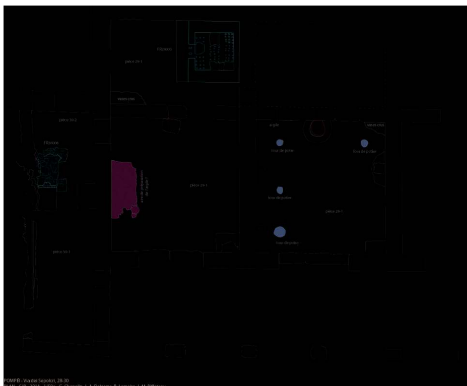
Fig. 11 - Plan de l'atelier de potier en 79 de notre ère.

G. Chapelin, J.-A. Delorme, B. Lemaire et J.-M. Piffeteau.