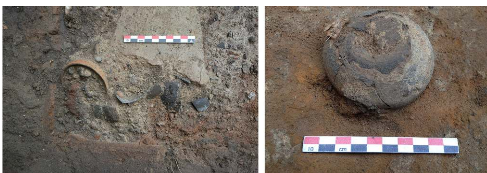
Fig. 10 - Fragments de gobelets et bols surcuits mis au jour dans les niveaux de cendres de la chambre de combustion du four FR30018.