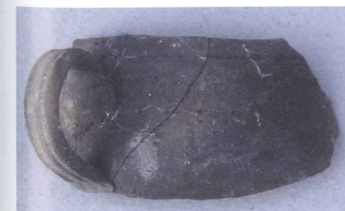
Gobelet à paroi fine cru, prélevé. Le décor incisé et l'engobe sont parfaitement conservés.