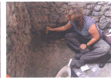
Le niveau de lapillis en cours de nettoyage dans lequel se trouvent les vases crus.