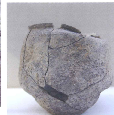
Gobelet à paroi fine surcuit, issu de la production de l'atelier, dans des niveaux antérieurs à 79 ap. J.-C.