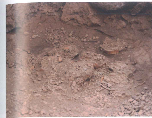
Les premiers vases crus apparus en dégagant le niveau de lapillis.