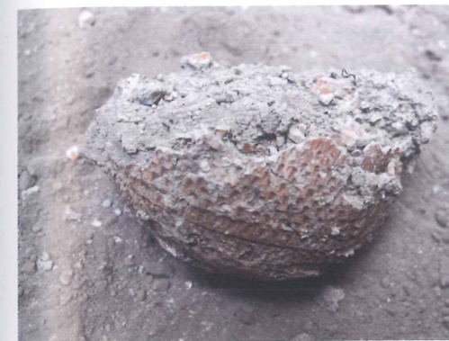
Gobelet à paroi fine cru, prélevé. Le décor incisé et l'engobe sont parfaitement conservés.