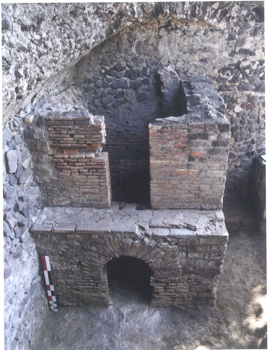
Le four vu depuis le nord-ouest avec les niveaux de cendres sortant de l'alandier.

L'ensemble a été dégagé entre le 15 octobre 1838 et le 11 novembre de la même année. Les informations relatives à la fouille du XIX e siècle se limitent à quelques lignes publiées en 1863 par G. Fiorelli mentionnant la présence du four et de céramiques. Les vases mis au jour, appelés « pignattini », renvoient, selon les régions d'Italie du Sud, à des cruches ou des vases à cuire. Il est également précisé que ces vases possèdent un manche. Tout laissait à penser qu'il s'agissait de céramique commune culinaire (des poêles par exemple).