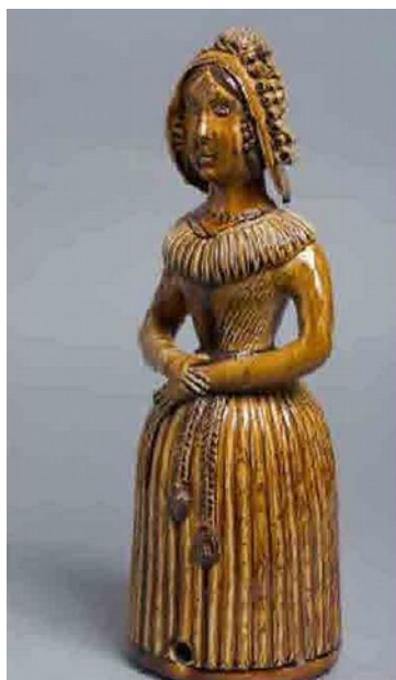
Photographie 20. La production imagière (céramique utilitaire populaire singularisée par des éléments figuratifs).

Corpus 4. Images (photographies 20, 21 et 22) regroupées sur une page des Annexes illustrant les parties historiques de la thèse, réalisée à partir d'images trouvées sur internet et commentées succinctement :