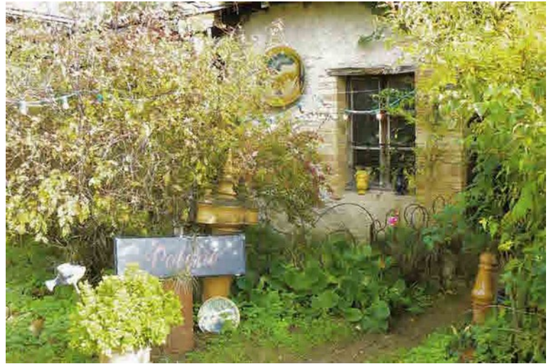
Photographie 24. La porte d'entrée de son atelier et son jardin agrémenté d'objets en céramique, visible dès l'arrive au domicile