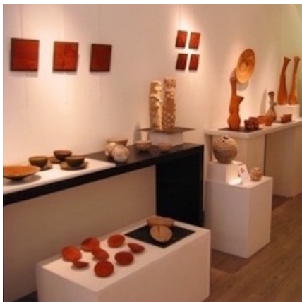
Photographie 16. Exposition en galerie d'un collectif de femmes céramistes faisant pour la plupart des objets « utiles »

Corpus 3. Images (photographies 16, 17, 18, 19) utilisées lors des restitutions plus tardives, incluant une photographie de lieu, et comportant à chaque fois un commentaire.