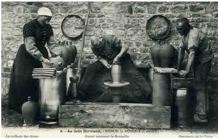
Photographie 22. Une poterie en 1908. La poseuse d'anse (habilleuse de pots), son mari le tourneur et à droite, le batteur qui prépare les pains d'argile pour le tourneur. https://ledouget.fr/#!/galerie-ceramique

J'ai également inséré des photos de fours à bois construits par des enquêtés, prises au cours des phases d'enquête (cf. images présentées dans le corpus 1). L'absence d'image, puis cette présentation de quelques images en guise d'illustration ont généré des effets indirects : les réactions qu'elles ont suscité parmi la communauté de chercheurs ont agi comme facilitateur de