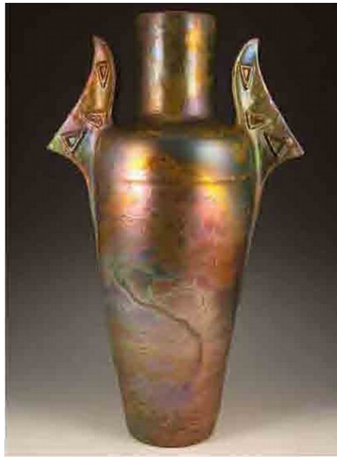
Photographie 21. Un vase de Clément Massier établi à Vallauris à partir des années 1880. Ses plats en faïence émaillée, ornés de fresques figuratives et paysagères aux lustres métalliques témoignent des expérimentations artistiques bien avant l'apparition massive des céramistes d'art. Base « Joconde » (Portail des collections des musées de France) : http://www.culture.gouv.fr/documentation/joconde/fr/pres.htm