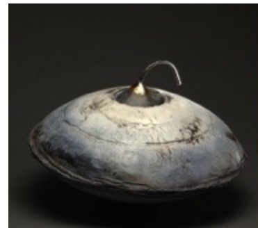
Photographie 17. Céramiste très connue exposant ses sculptures... sur des « marchés de potiers » (env. 50cm de diamètre)