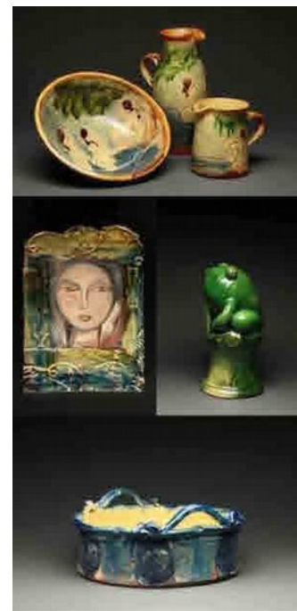
Photographie 26. Quelques unes de leurs productions en terre vernissée, en majorité utilitaire Site de l'association régionale D'Argile dans laquelle ils sont adhérents.