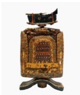
Photographie 18. Boîte (env. 15cm de haut)