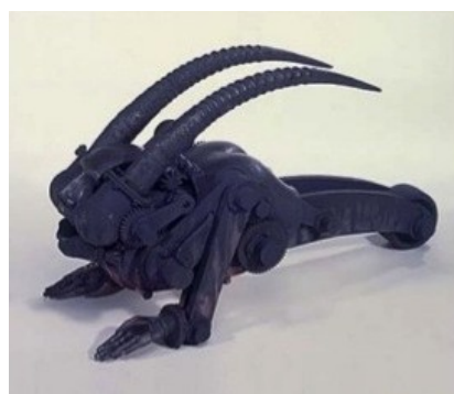
Photographie 19. Sculpture (70x35x40cm de diamètre)

Plus tard, lors de la phase de rédaction de ma thèse, j'ai inséré un volet « illustrations » dans les Annexes correspondant à différents chapitres du manuscrit. Une page renvoyant par exemple aux chapitres 1 et 2 illustre la naissance de la céramique d'art au XX e siècle à partir des supports suivants : une carte postale ancienne, et la reproduction de différentes pièces et outils de céramistes du début du siècle ou contemporains, toutes trouvées sur internet.