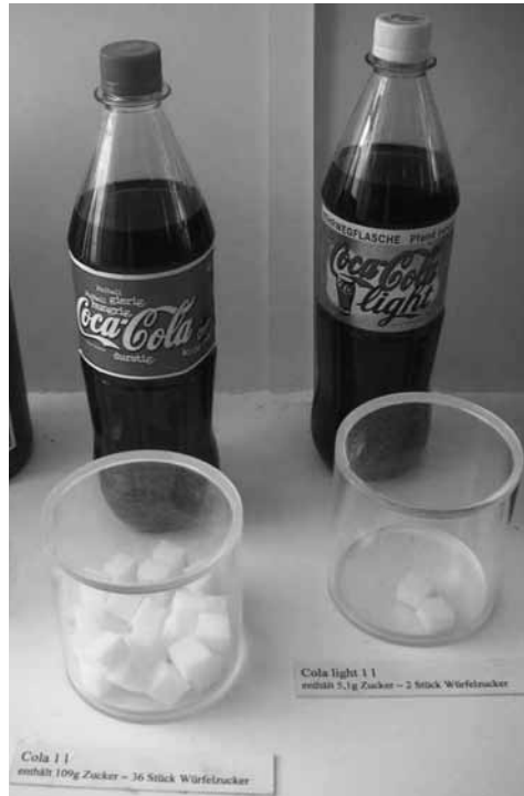
Illustration 2 : Coca-Cola et Coca-Cola light, différence de contenance de sucre (Musée du sucre à Berlin) 4 .