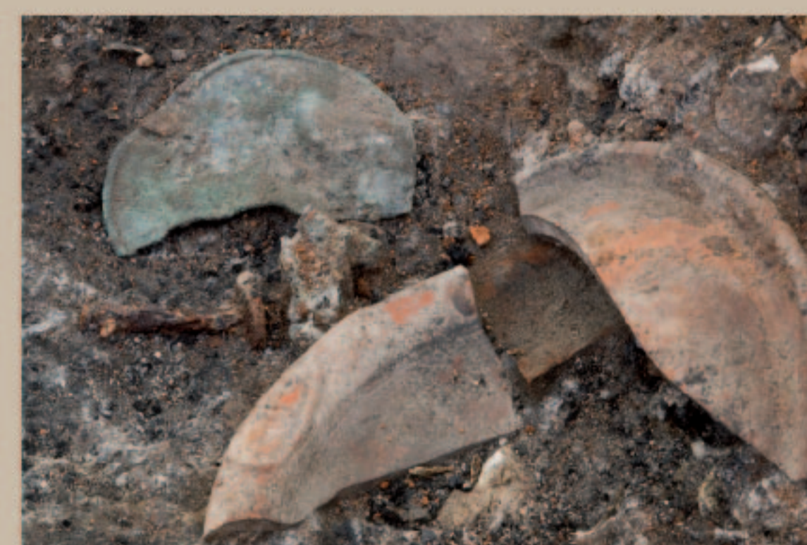
Mobilier découvert dans les structures de crémation INC 14 et INC 17