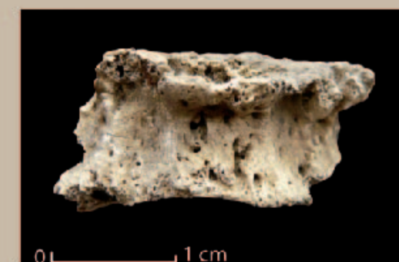
Fragment de vertèbre brûlée présentant des atteintes pathologiques (arthrose)

L'approche archéo-anthropologique, fait appel à une multitude de données: outre l'étude des éléments propres à la sépulture (biologie, architecture, taphonomie, mobilier, etc...), elle prend en compte la spatialisation des éléments dans la structure, mais également celle de la structure au sein de l'ensemble funéraire, puis plus largement au niveau régional. Cette approche archéo-thanatologique est indispensable dans le cadre d'une étude funéraire et est à associer à l'analyse des données historiques, environnementales et archéologiques locales. Elle participe ainsi du prisme de lecture multiple nécessaire à la compréhension optimale de ces ensembles funéraires. Cette approche a fourni des résultats significatifs sur le site de Richeaume XIII.