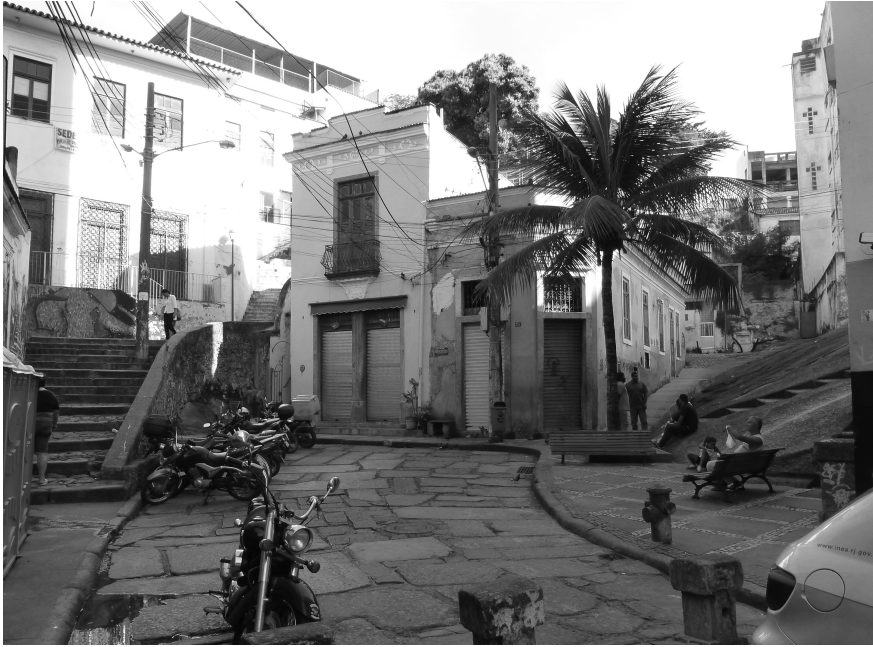
Fig. 2 La « Pedra do Sal », au pied du Morro da Conceição (N. Bautès, 2013) “Pedra do Sal”, at the foot of Morro da Conceição (N. Bautès, 2013)

est originaire Frère Eckart, mais aussi par des institutions civiles et religieuses internationales 9 , cette initiative a conduit à soutenir des activités économiques et caritatives et, ainsi, à asseoir l’ancrage territorial de cette église. Dans le même temps, elle a renforcé l’influence de la VOT dans la sphère politique locale, influence qu’elle a rapidement mobilisée au service d’une politique lui permettant de libérer les bâtiments occupés illégalement pour envisager la construction de résidences à destination des couches moyennes aisées.