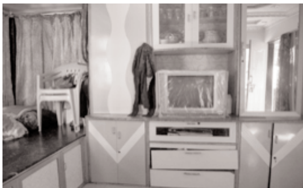
Ahmed Zakarya Nagar/Behrampada, 17 m 2

Ces témoignages, qui doivent être considérés dans leurs contextes sociopolitiques et temporels nationaux et, à ce titre, faire l'objet d'une prudence quant à leur interprétation, mettent en évidence la richesse de la mise en mots des situations individuelles et familiales vécues dans leurs lieux. Au travers de ces brèves mises en récits peuvent ainsi être révélés des fragments de l'espace vécu d'habitants confrontés à des changements socioéconomiques majeurs dont les conséquences sont observables dans les lieux de leur quotidien. En dépit des spécificités et des différences qui caractérisent les logiques sociopolitiques, la nature et la rapidité des changements à l'œuvre dans les deux contextes mobilisés ici pour exemple, les relations des individus et des groupes sociaux à l'espace et leurs représentations de la vie sociale ne sont pas dénués de tendances générales face auxquelles les chercheur-es sont en mesure de contribuer, comme le suggérait Renée Rochefort, à « la prise de conscience collective et à la solution des problèmes de société » (Rochefort, 1961)?