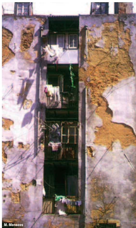
fig. 4 Immeuble dégradé du quartier de la Mouraria

a été trouvé mort ici et elle est venue demander, et nous avons fait une cérémonie pour lui; on contribue, parfois, à ces choses-là. Mais jusque-là (...), ceux qui apparaissaient comme ça sans-abri, il y en avait peu, ils dormaient sur les escaliers de nos immeubles et on les laissait. On les connaissait, on commençait à parler, ils venaient de la campagne, n'arrivaient pas à trouver du travail, et ils devenaient alcooliques et nous on les laissait dormir; ils ne faisaient rien de mal, ils n'urinaient pas dans la rue, ils ne faisaient rien que l'on puisse leur reprocher. Ici arrivait pas mal de monde des provinces et nous on les aidait comme on pouvait. Aujourd'hui on peut plus, hein? Parce qu'il y en a tant qu'il n'y a plus de possibilité de faire quoi que ce soit. » (D. Júlia)