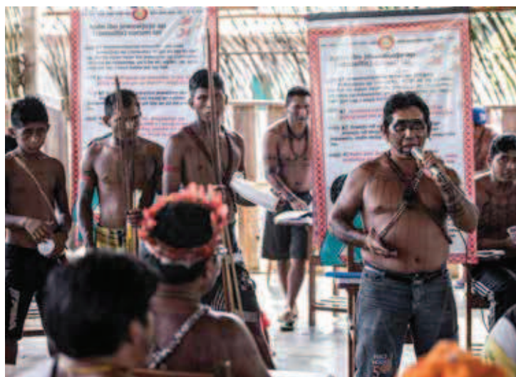
Imagem 3. Indígenas Munduruku em oficina sobre o direito à consulta livre, prévia e informada, na aldeia Waro Apompu, Terra Indígena Munduruku. Por Maurício Torres, set. 2014.

Os Munduruku, entretanto, não se espantaram quando, transcorridos menos de dez dias da reunião, o governo federal desrespeitou absolutamente o que fora acordado e, por meio do Ministério de Minas e Energia (MME), publicou a Portaria nº485, agendando o leilão da (pre-tensa) UHE São Luiz do Tapajós para 15 de dezembro seguinte. Note-se: o leilão só poderia ocorrer após a LP, a ser conferida pelo Instituto Brasileiro do Meio Ambiente e dos Recursos Naturais Renováveis (Ibama), ao passo que a LP, por ordem judicial, deveria ser necessariamente precedida pela CLPI. Ou seja, sem considerar todas as dificuldades de comunicação entre os Munduruku e os não índios, algumas das quais elencadas no presente texto, o governo pretendia tomar por “entendido” pelos indígenas, em ques-