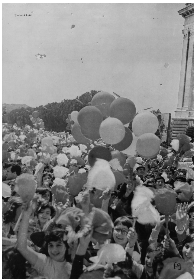
Photo 2 – Jour de fête. Photographie publiée dans le magazine Ylli en mai 1980, sans nom d'auteur.

Les ethnologues de la période communiste ont eu tendance à dévaloriser tout ce qui avait précédé, notamment les entreprises de collecte et de publication de matériel ethnologique et folklorique conduites dans l'entre-deux-guerres. Dans le même temps, soucieux de faire remonter aussi loin que possible les origines de l'« ethnie » albanaise, ils voyaient dans les auteurs antiques et médiévaux des sources pour l'ethnologie des Albanais. Avec le tournant nationaliste de la classe dirigeante, dans les années 1960,