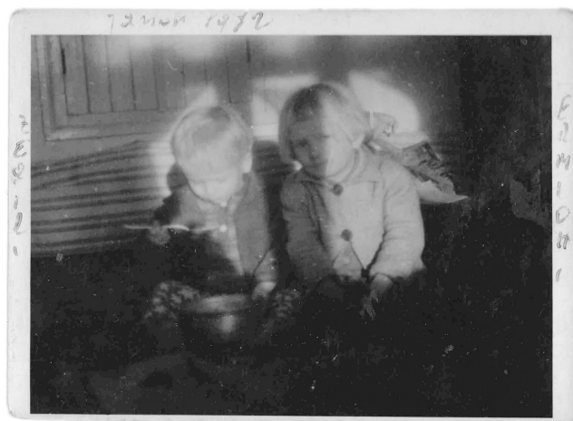
Photo 4 – La « spontanéité » comme marque de la photographie amateur : deux photos extraites de l'album de I. H. datées de janvier 1972. « Mes enfants se disputaient une casserole de nourriture que leur avait donnée leur grand-mère : à ce moment, j'ai sauté sur mon appareil photo et j'ai fait la photo, mais la lumière était mauvaise. »