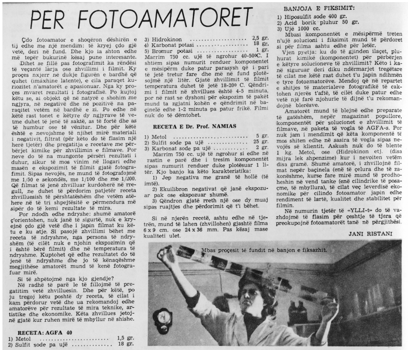
Photo 1 – « Pour les photographes amateurs », rubrique publiée dans la revue Ylli en février 1963, par Jani Ristani.

photographique est organisé en 1974. Il est possible que le mouvement se soit prolongé plus tard dans les régions périphériques, moins directement soumises aux décisions prises dans la capitale. À Korçë, selon le témoignage d'un ancien photographe, les cours de photographie pour les pionniers s'interrompent dans la seconde moitié des années 1970, en raison de difficulté d'approvisionnement 12 .