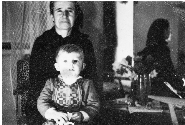
Photo 7 – La recherche de la différence dans la photographie de famille : composition de H. R., région de Gjirokaštër, 1969.

P. T. tente de capturer le mouvement et se fait photographe sautant d'un rocher (Shpat, années 1960).