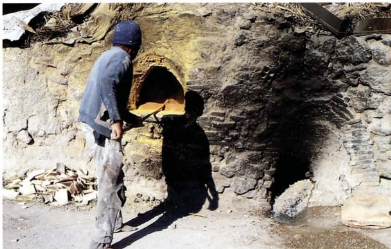
1 Fournette destinée au grillage du plomb et à sa transformation en oxyde (de couleur jaune). Atelier de Fès, Maroc

Les glaçures plombifères et alcalines ont la composition de verres au plomb et de verres sodiques, et, d'ailleurs, les premières phases de la préparation des glaçures et des verres présentent de fortes analogies.