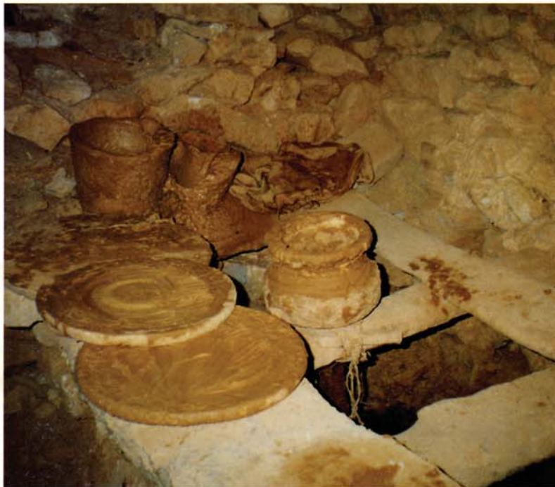
Atelier de potier Guellala, Jerba (Tunisie) Époque contemporaine