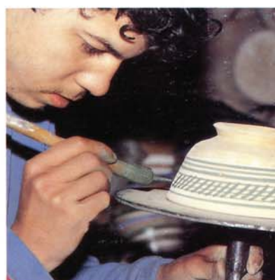
3 Peinture sur biscuit de bols au décor sous glaçure. Atelier de Fès, Maroc