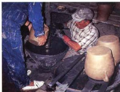
2 Pose de la glaçure plombifère à l'intérieur des pots par arrosage, vidage du surplus, égouttage. Atelier d'Agost, Alicante, Espagne

Lorsqu'une glaçure transparente ou opaque doit être teintée dans la masse, le colorant, très soigneusement broyé, peut être ajouté à la suspension aqueuse, mais il peut aussi être mélangé aux oxydes de plomb et d'étain dans la fritte.