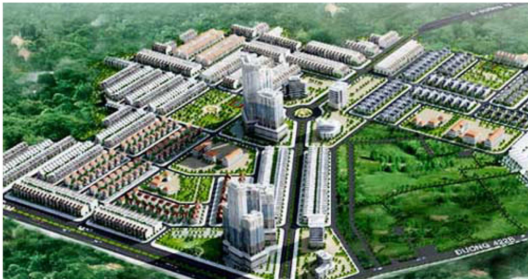
Illustration 3. Modernité urbaine, zonage fonctionnel et exclusivité: la stratégie marketing des nouvelles zones urbanisées