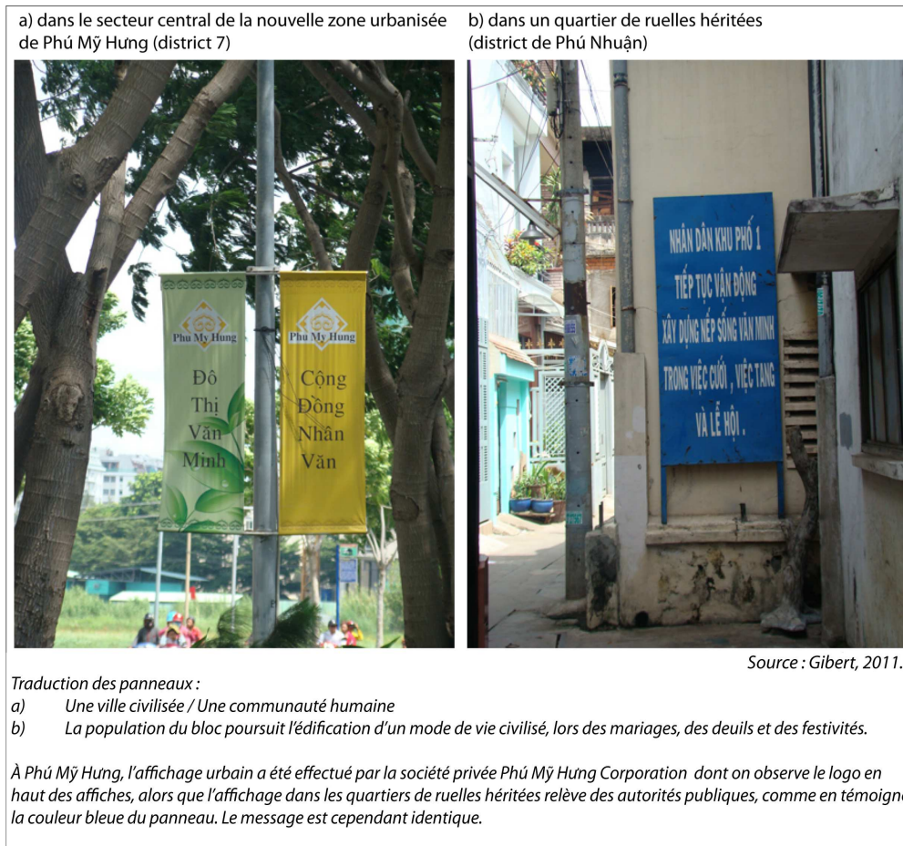
Illustration 1. Les réglementations associées aux programmes des « quartiers civilisés » à Hồ Chí Minh Ville