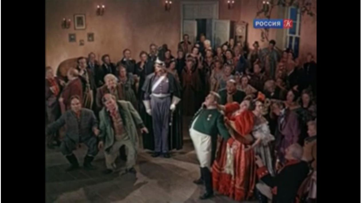
Capture d'écran de l'adaptation cinématographique de Vladimir Petrov de 1952

Qu'est-ce qui provoque la scène pétrifiée à la fin du Révizor ? L'annonce que fait le gendarme renvoie tous les personnages au début de la pièce, lorsque l'arrivée d'un fonctionnaire important, le « révizor », est l'élément déclencheur de l'intrigue fondée sur un quiproquo. C'est une boucle qui se referme, ou plutôt l'éternel recommencement qui remet tout en cause et pétrifie les personnages dans une position grotesque, détaillée par Gogol car il souhaitait que l'attitude correspondît aux traits de caractère de chacun. Comme son nom l'indique, la scène muette ne comporte pas de paroles, à la manière du cinéma muet de Buster Keaton auquel Kurtág fait référence – un cinéma où l'absence de parole était compensée par le corps , par les postures et les attitudes des acteurs. La condition de la pantomime est précisément d'évoluer sans langage, en n'utilisant que le geste, la danse ou les mimiques. Pantomime figée, la dernière scène du Révizor n'est pas loin d'accéder au langage, comme tentent de le faire le Directeur des Postes transformé « en point d'interrogation », Ziemlianka qui « tend l'oreille », et surtout le Juge qui fait mine de « siffler ou prononcer » un dicton : « On n'a pas fini d'en voir ! ».