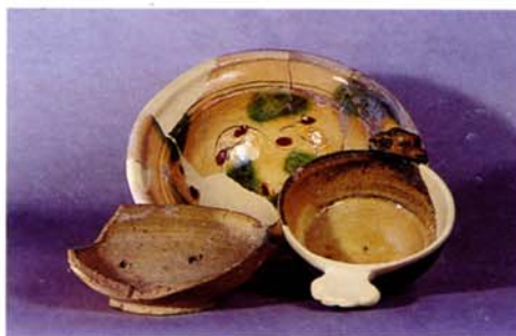
Fig. 1. Deux assiettes à décor incisé et glacure jaune à taches vertes et marron.