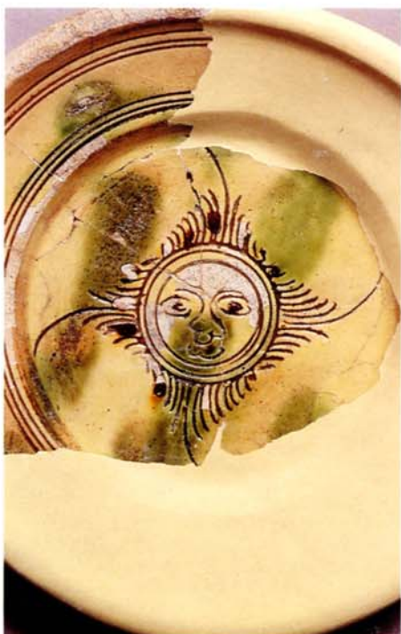
Fig. 4. Assiette à décor incisé à motif au soleil.

en pâte calcaire bien épurée, systématiquement recouverte d'engobe blanc ou rouge et d'une glaçure plombifère. Si les services de table sont les plus abondants, l'association de récipients sanitaires mais aussi culinaires impliquant une autre préparation de l'argile rend compte de la polyvalence des artisans qui ont dû répondre aux besoins multiples de la population locale.