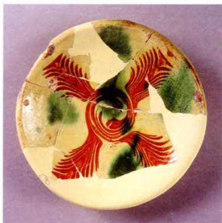
Fig. 3. Assiette à engobe marbré, à taches vertes.