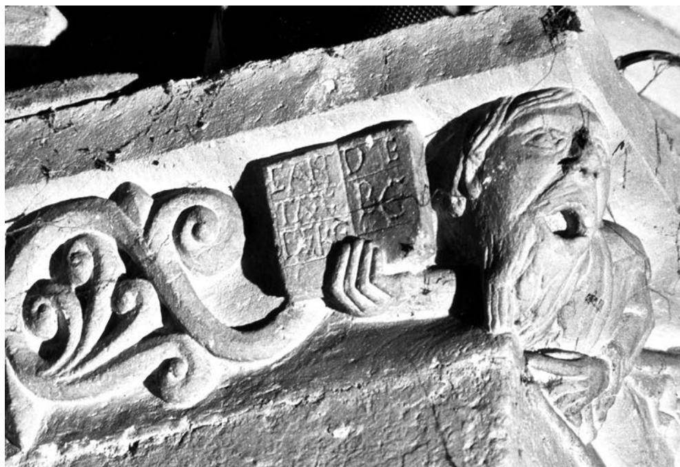
Fig. 15. Saint-Quentin-de-Baron, iglesia. Capitel del cantor

La representación de esos gritos sin ruido, de la presencia de la palabra sin el sonido que la pone en signo, es precisamente el medio de describir en el campo visual lo que pasa en la iglesia. La expresión perfecta de la infinitud de Dios no es sino experiencia interior de silencio y de luz, dos imágenes de la armonía celestial y de su reflejo microcósmico en el corazón del que reza. El silencio se convierte entonces en el signo de algo impronunciable y por ello se puede representar en las imágenes medievales. De esta manera se produce un desajuste semiológico e iconográfico: el silencio se convierte en objeto visual porque pone en signos los límites de lenguaje articulado frente a la infinitud del misterio de Dios 80 .