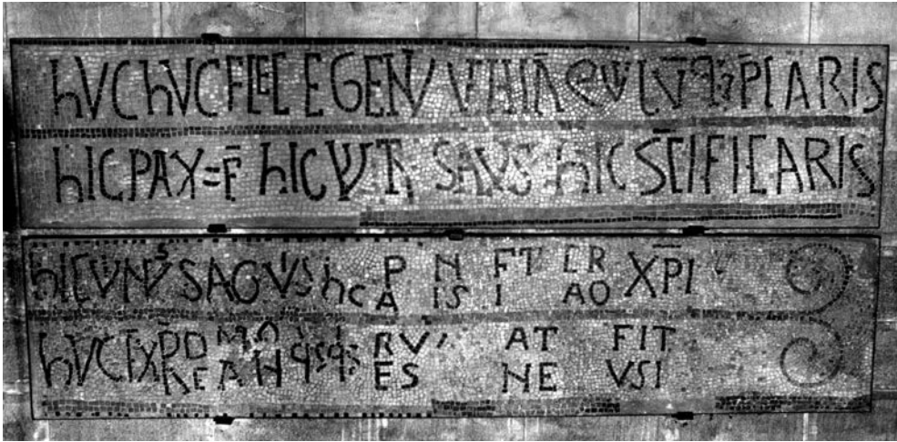
Fig. 10. Lyon, Saint-Martin-d'Ainay. Mosaico del altar mayor

la redención y la santificación se manifiesta hic et nunc en la inscripción y el sacramento se instituye en un presente continuo asegurado por el monumento epigráfico y su instalación en el corazón de la iglesia 39 .