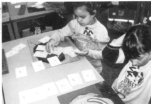
Non pas les laisser devant la seule sanction de leur réponse mais leur faire des contre-suggestions techniques

demandent des éclaircissements sur le sens de l'énoncé, en particulier sur ce que veut dire: il a perdu en tout . Par le seul jeu sur les nombres donnés, l'expérimentateur est à même de provoquer des changements notables dans l'interprétation de l'énoncé en entier. L'expérience est très convaincante et ne demande pas d'autre commentaire. Le lecteur n'aura pas de difficulté à imaginer que le jeu peut se poursuivre avec d'autres énoncés. Ainsi entre-t-on en jeu avec les glissements de sens que j'ai mis en évidence dans ma recherche sur ces problèmes (Conne 84), en montrant que les élèves pouvaient fort bien résoudre un problème de transformations en plaquant un schéma d'états, et trouver par cette méthode la réponse attendue (pour l'évocation de ces jeux