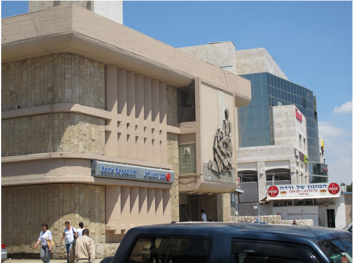
Ancienne mairie transformée en banque, au second plan, le centre commercial qui abrite la nouvelle mairie au dernier étage.

consommer, la perception de la faiblesse du pouvoir d'achat s'accroît. Le nouvel Israël consumériste paraît bien loin du mythe égalitariste qui avait prévalu à ses débuts.