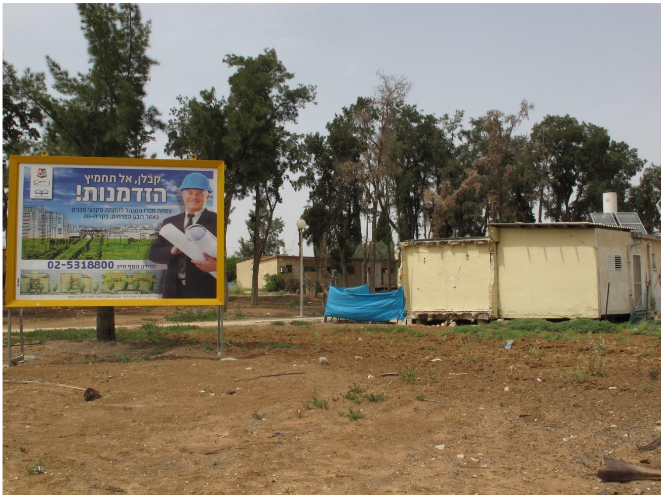
A gauche, une affiche présentant les ambitions de la municipalité, à droite les anciennes ma'abarot vouées à l'abandon politique.

A quelques mètres du centre « d'absorption » où vivent entassés de nombreux Ethiopiens, un nouveau projet immobilier entend attirer les classes moyennes, locales et non locales. L'idée est de (re-)donner une image positive du cœur de la ville nouvelle, secteur le plus économiquement déprimé de la petite agglomération, les nouveaux développements urbains de standing un peu supérieur s'effectuant tous à sa périphérie. Cela est pour partie dû à la promotion immobilière locale, celle-ci souhaitant séduire les employés des nouvelles entreprises récemment installées dans la zone industrielle à quelques kilomètres de Kiryat Gat. Celle-ci était initialement dévolue aux transformations des produits agricoles et à l'industrie traditionnelle, mais ces activités en nette perte de vitesse (l'usine textile de Polgat ferme dans les années 1990) ont été complétées/remplacées par des implantations d'entreprises informatique, domaine dans lequel Israël excelle, mais qui, hormis pour les emplois peu qualifiés, s'insère mal dans une économie urbaine d'une "ville de développement" comme Kiryat Gat. Avec une aide de plus de 500 millions de dollars du gouvernement israélien, une première usine Intel ouvre en 1999 (fabrication du Pentium 4), suivie d'une seconde en 2006/2008. Ces industries high tech ne s'articule à la ville que par une consommation en passant. Malgré la présence de ces entreprises prestigieuses (Intel, HP) et leur indéniable apport financier au budget communal, les