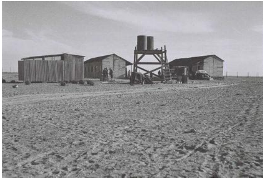
Kiboutz Tze'elim à sa création en 1949

Suite à l'échec relatif de l'intégration des immigrants des années 1950, échec auquel le kiboutz a largement contribué, se sont cristallisés dans la société juive israélienne des années 1960-70 deux secteurs de population, qui au lieu de se "fondre" 2 en une même culture suivant le modèle prôné alors par les élites, se sont constituées en alternatives culturelles qui déboucheront sur le post-sionisme (Kimmerling 2001). D'une part l'Israël des anciens de la période pré-étatique (" vatikim "), élite socio-économique ashkénaze, et d'autre part les nouveaux, pour la plupart Orientaux, prolétariats des régions périphériques. Dans ce clivage, le kiboutz n'est plus perçu comme un mouvement révolutionnaire, avant garde du socialisme, une utopie assoiffée de justice sociale, mais plutôt comme un des compartiments privilégiés de la société, utilisant à ses fins productivistes un prolétariat "fruste" d'origine orientale. En effet, bien qu'opposé idéologiquement au travail salarié, du fait de l'exploitation qui l'accompagne, le kiboutz devient en périphérie de l'espace (social) israélien un des principaux, sinon le principal employeur.