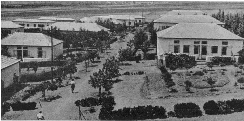
Vue du Kiboutz Ein Harod, fondé en 1921, dans les années 40.