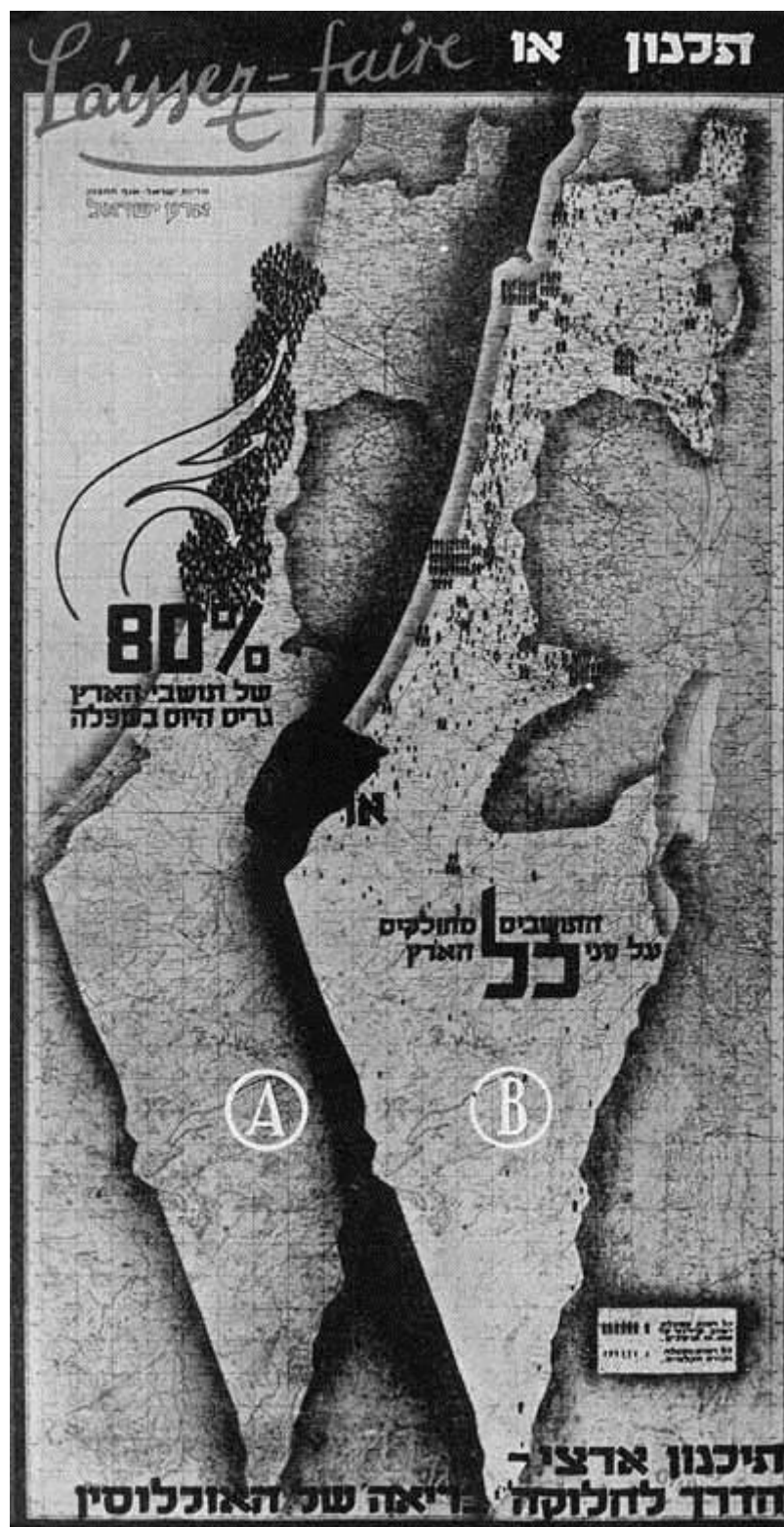
Affiche à l'exposition d'urbanisme, Arieh Sharon (Département de l'aménagement du territoire), Musée de Tel-Aviv (1950)