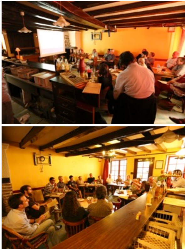
Figure 3 : Projection débat organisé dans un café

débats » traduisant les résultats de la recherche historique ont permis une compréhension plus complexe des situations socio-écologiques et interactionnels dans lesquelles le collectif était inscrit. Ce dépassement inclusif offre la possibilité de passer d'un projet initialement à vocation sanitaire à l'émergence des grands linéaments d'un projet plus large de développement local.