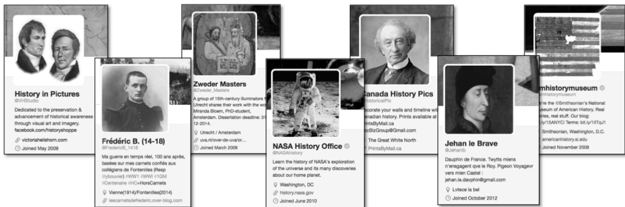
Figure 1. Exemples de comptes Twitter à caractère historique.

Nous proposons une analyse d'un certain nombre de comptes Twitter présentant des caractéristiques très différentes. On verra que la montée en puissance des comptes commerciaux est basée sur des stratégies relativement simples, de l'achat de followers à l'auto-référencement. Dans un second temps, nous établirons une typologie des usages des documents historiques à des fins de communication sur les médias sociaux. Ce classement, qui se veut également un outil pour les institutions qui seraient tentées de mettre au point leur propre projet de médiation culturelle sur ces plateformes, montrera en particulier que la palette des usages ne se restreint pas forcément au partage de ressources mais tient parfois beaucoup plus du récit et de la mise en scène.