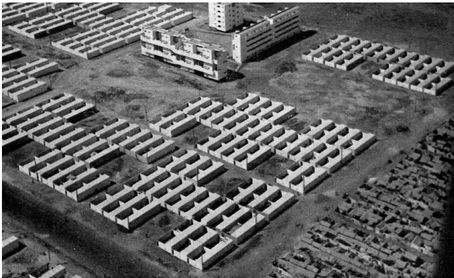
Ill. 1 : Les Carrières Centrales M. Ecochard, 1955

En effet, cet habitat musulman horizontal (ill.1) est "évolutif", c'est-à-dire transitoire : son remplacement par des immeubles verticaux, implantés sur la même trame urbaine, est prévu "suivant l'élévation du standard de vie" de la population musulmane. Cette adaptation (beaucoup discutée au congrès d'Aix-en-Provence des CIAM de 1953) permet de mesurer à quel point l'idée d'une spécificité marocaine de l'habitat a occupé une place importante dans la culture technique des services de l'urbanisme au Maroc.