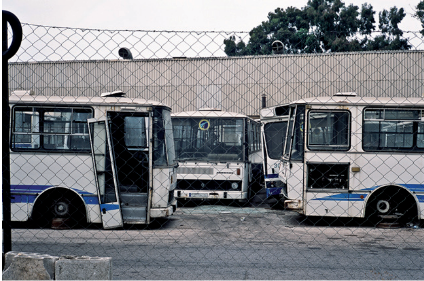
Photo 2 : « Le cimetière de bus », crédit photo Pedro Gonçalves, juillet 2008

Cimetière de Bus de Beyrouth, situé dans le quartier de Mar Mikhael. Sur les 250 bus mis en service en 1997 fournis par la SEMVAT (ancienne société toulousaine des transports publics), sous l'égide de la Région Midi-Pyrénées, à L'O.C.F.T.P (Office des Chemins de fer et Transport en Commun), seule une trentaine circule encore aujourd'hui. Le cimetière de bus représente la décadence des transports en commun suite à la guerre civile. Les transports collectifs s'évaporent vers les transports privés. Le privatif domine, des minibus privés viennent emprunter les lignes de bus. Là où des tramways, chemins de fer, et bus participaient à la dynamique urbaine de Beyrouth depuis le début du 20 e siècle, ne subsistent aujourd'hui que les vestiges des carcasses des transports en commun dans des cimetières de machines (gare et trains abandonnés, bus délaissés) 21 .