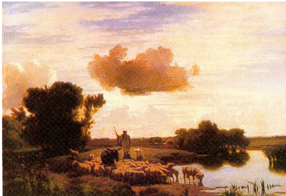
Fig. 3 : Károly LOTZ (1833-1904), Crépuscule (1870) huile sur toile - coll. Galerie Nationale, Budapest

Et même Laszlo Paál (1846-1879), célèbre paysagiste hongrois proche de l'école de Barbizon, a débuté par une peinture plus romantique de l'Alföld, en témoignent ses Bergeries de 1872 : là encore, le tableau illustre des archétypes du paysage hongrois, avec la large part de ciel, les troupeaux à l'horizon et la steppe désolée, dans laquelle seule deux bergeries isolées viennent ponctuer un sentiment de monotonie et de solitude tout à fait dans l'esprit romantique (Figure 4).