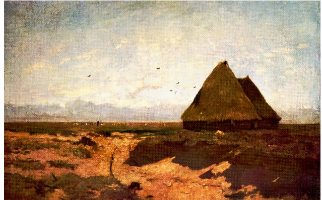
Fig. 4 : László PAÁL (1846-1879), Bergeries (1872) huile sur toile - coll. Galerie Nationale, Budapest