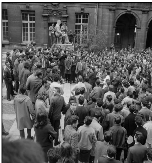
Rassemblement dans la cour de la Sorbonne des étudiants lors d'une manifestation contre l'OAS à la suite du procès de Salan. Paris (75), place de la Sorbonne, 24 mai 1962 (cote 100-18/62 2139 - 1666).

Il faut resituer les pratiques militantes de l'époque dans ce cadre contextuel. La brutalité des répertoires d'action policiers et les mesures d'exception qu'autorise la constitution de 1958 éclairent « la manière dont la violence peut être pensée, légitimée, instituée et, finalement, incorporée et exercée 84 » sans retenue par les forces de police 85 . Le traumatisme de la Shoah chez les militants d'origine juive doit sous ce jour être considéré comme un facteur important – parmi d'autres – qui expliquent le façonnage du rapport à la violence, car ce contexte contribue également à expliquer la diffusion de répertoires d'action politique qui n'excluent pas le recours à la violence parmi les opposants, notamment chez les militants d'extrême gauche. Dans ce cas, d'autres facteurs peuvent également être évoqués, comme l'influence d'un modèle dominant de militantisme inspiré du « révolutionnaire professionnel » de Lénine, valorisant des attributs et qualités socialement codées comme « masculines » et « viriles », comme la combativité (au sens large) et l'aptitude au recours à la violence, mais aussi les conséquences des rapports conflictuels, souvent physiquement violents, qui opposent les militants de la LCR et des organisations trotskystes à ceux du PCF