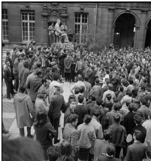
Rassemblement dans la cour de la Sorbonne des étudiants lors d'une manifestation contre l'OAS à la suite du procès de Salan. Paris (75), place de la Sorbonne, 24 mai 1962 (cote 100-18/62 2139 - 1666).

Il faut resituer les pratiques militantes de l'époque dans ce cadre contextuel. La brutalité des répertoires d'action policiers et les mesures d'exception qu'autorise la constitution de 1958 éclairent « la manière dont la violence peut être pensée, légitimée, instituée et, finalement, incorporée et exercée 84 » sans retenue par les forces de police 85 . Le traumatisme de la Shoah chez les militants d'origine juive doit sous ce jour être considéré comme un facteur important – parmi d'autres – qui expliquent le façonnage du rapport à la violence, car ce contexte contribue également à expliquer la diffusion de répertoires d'action politique qui n'excluent pas le recours à la violence parmi les opposants, notamment chez les militants d'extrême gauche. Dans ce cas, d'autres facteurs peuvent également être évoqués, comme l'influence d'un modèle dominant de militantisme inspiré du « révolutionnaire professionnel » de Lénine, valorisant des attributs et qualités socialement codées comme « masculines » et « viriles », comme la combativité (au sens large) et l'aptitude au recours à la violence, mais aussi les conséquences des rapports conflictuels, souvent physiquement violents, qui opposent les militants de la LCR et des organisations trotskystes à ceux du PCF