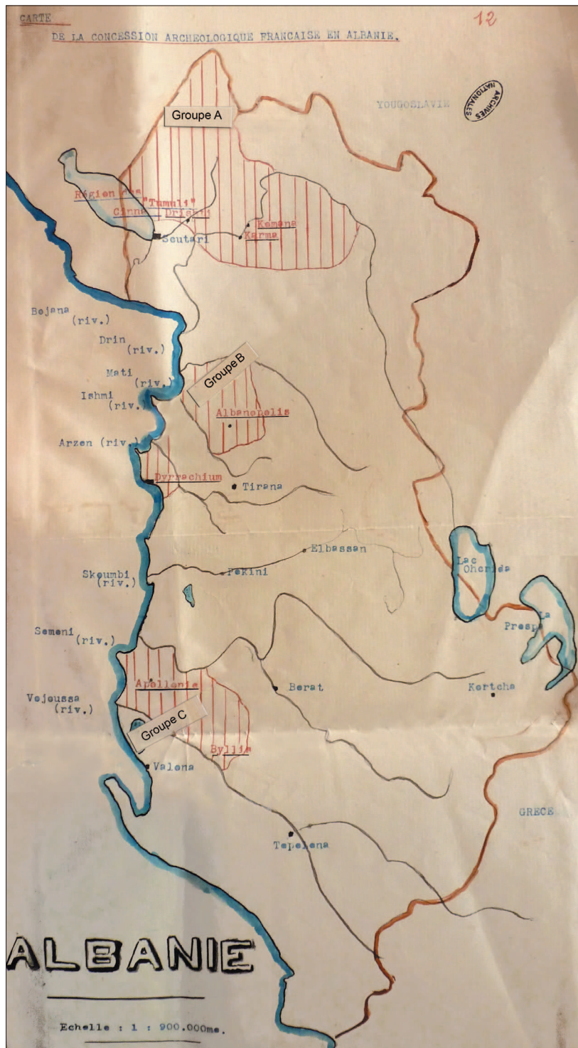
Fig. 4 Carte du projet de convention archéologique (1 er mai 1923).