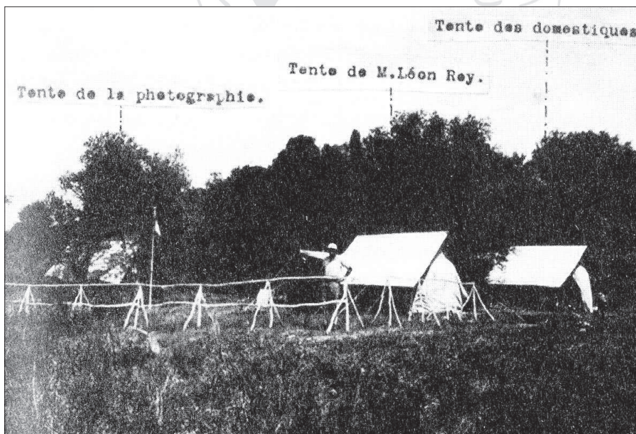
Fig. 3. Les tentes de Léon Rey à Apollonia ; d'après Rama 2010, 77.

Éléments sous droit d'auteur - © Ausonius Éditions septembre 2015 : embargo de 2 ans