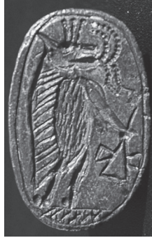
FIG. 1. – Chaton de la bague en argent RS 23.268 (Damas 6503), H. 2,29 cm, Ras Shamra-Ougarit, « Ville Sud », Bronze récent (Mission de Ras Shamra, cliché de l'auteur).

présence de trois tiges, à l'extrémité en forme de globule, qui prennent naissance au-dessus du museau. Cette « coiffe » n'est pas habituelle pour la « déesse-hippopotame » 13 . Elle pourrait rappeler les éléments de la flore nilotique figurés sur les figures d'hippopotame en faïence d'époque plus ancienne 14 , ou les tiges florales de coiffures féminines du Nouvel Empire, du type de celle que porte la figure féminine représentée sur le vase de Niqmaddu (RS 15.239, Damas 4160) 15 . Le choix de cet élément indiquerait-il la volonté de souligner le domaine de la féminité, un lien avec une femme de la famille royale ou encore avec la déesse Hathor ?