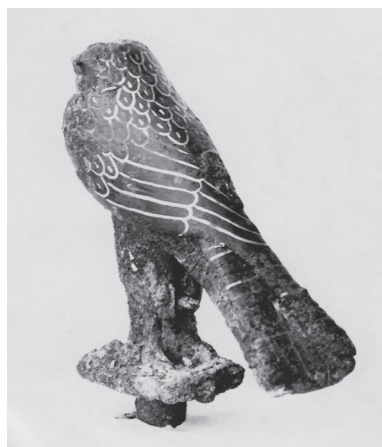
FIG. 7a et b. – Deux vues de la statuette de faucon (Alep 4532), bronze avec incrustations d'or (ou d'électrum), H. 7,8 cm, Minet el-Beida, « dépôt égyptien ».