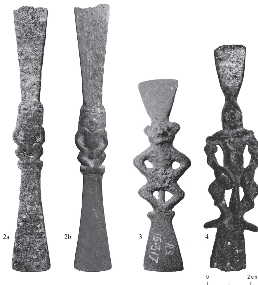
FIG. 2a et b. – « Spatule » ou « rasoir » double en alliage cuivreux RS 4.016 (Louvre AO 15719), H. 12 cm, Minet el-Beida (a/ avant restauration, Mission de Ras Shamra, fonds Schaeffer, Collège de France, b/ après restauration, cliché de l'auteur).