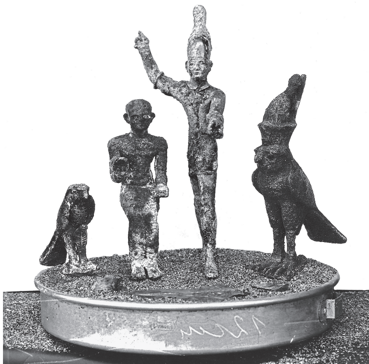
FIG. 6. – Les quatre bronzes du « dépôt égyptien » de Minet el-Beida, regroupés et placés dans une gamelle métallique moderne remplie de sable pour la photographie, 1929 (Mission de Ras Shamra, fonds Schaeffer, Collège de France).