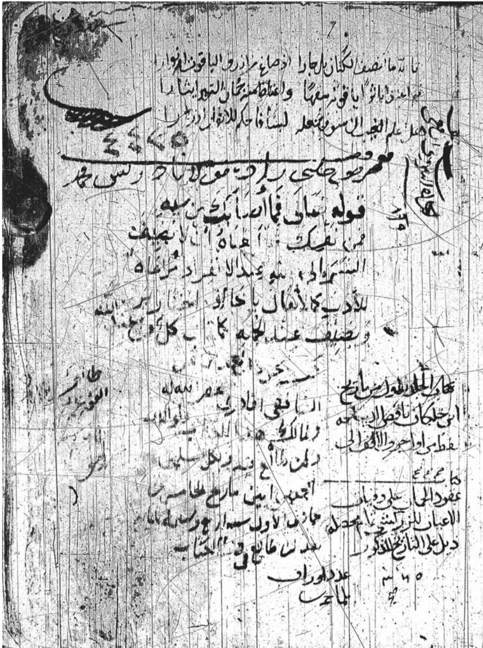
Istanbul, Bibl. Süleymaniye, ms. Fatih 4435, 361 fol., IRHT-reprod. n° 52197, Fonds Molé, fol. 2 r Al-Zarkašī Badr al-Dīn, Uqūd al-ḡumān al-musammā Dayl Ibn Ḥallikān .

Zarkašī, qui fait suite au Wafayāt d'Ibn Ḥallikān »). Écrit à Edirne en Turquie en 1094/1683 ». On ne relève aucune inscription marginale dans ce manuscrit, ce qui permet de supposer qu'il n'a pas circulé, ni même été lu dans une séance de lecture, car on n'y relève pas de certificat de lecture, d'audition ni de transmission.