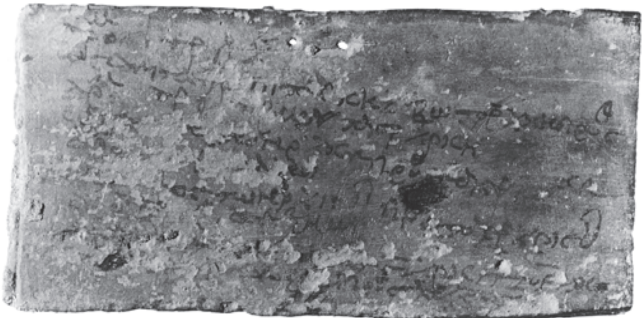
Fig. 2. Une tablette scolaire mathématique de Tebtynis (face B).