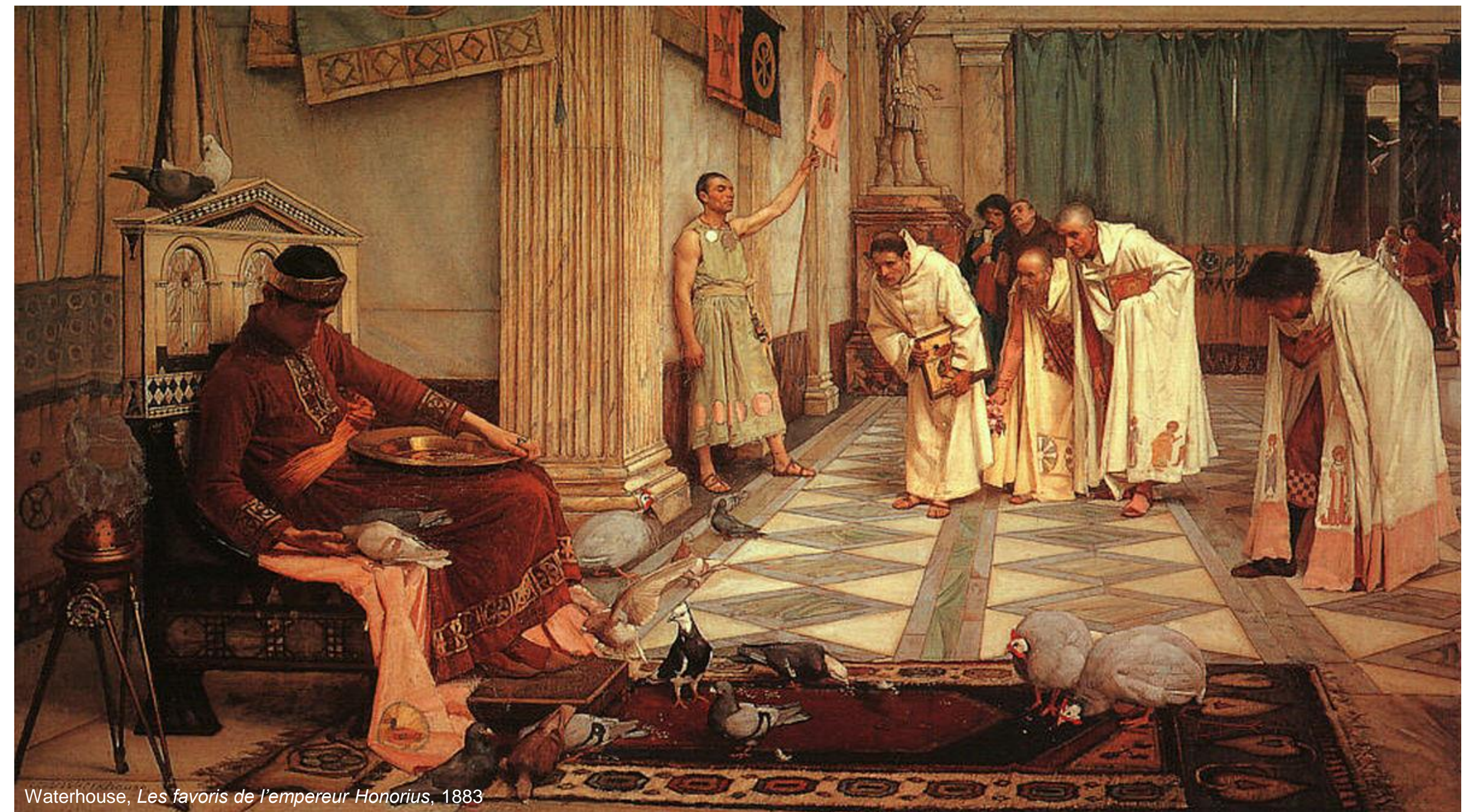
Waterhouse, Les favoris de l'empereur Honorius, 1883

Adoption au mérite ↔ Transmission dynastique du pouvoir