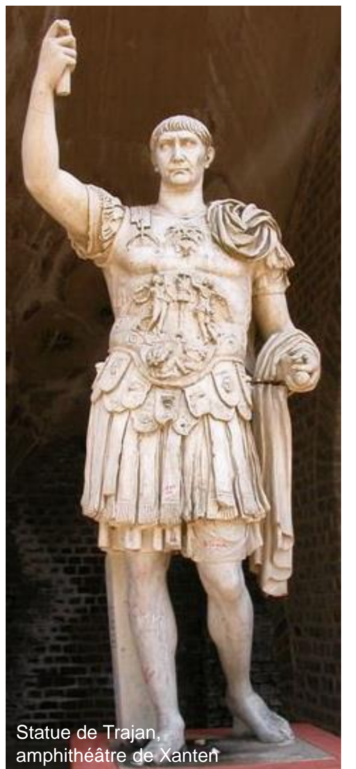
Statue de Trajan, amphithéâtre de Xanten

Claudien se sert de la figure de Trajan pour porter un programme politique. Honorius ne mérite pas d'être loué parce qu'il est aussi bon empereur que l'a été Trajan ; il méritera de l'être quand il suivra le programme prescrit par le poète. Le panégyrique se transforme en contrat moral conclu entre l'encomiaste et son sujet. Choisir de mettre en valeur l'héritage de Trajan, c'est placer Honorius dans la lignée du prince-citoyen, et appeler de ses vœux une forme de règne qui s'oppose en tout point à la royauté orientale de son frère Arcadius à Constantinople.