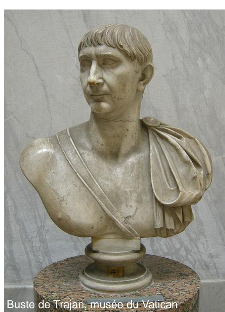
Buste de Trajan, musée du Vatican