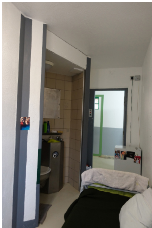
IMAGE 7. EMPLACEMENT DES PHOTOS PERSONNELLES DANS UNE CELLULE

Si pendant la détention, les relations s'usent, voire se rompent dès le début de l'incarcération, d'autres naissent ou se cimentent. Les ruptures sont fréquemment avancées par les professionnels, elles le sont moins dans les discours des jeunes, comme si le temps de la détention était un temps suspendu pour une grande partie d'entre eux, après laquelle « ils verront en sortant ». Avec l'incarcération, les relations amoureuses et affectives des jeunes sont mises à l'épreuve de la séparation physique, d'une plus faible communication orale (certains passent de journées au téléphone ou par SMS à un appel tous les deux ou trois soirs). Pour maintenir les liens, il arrive que les personnes au dehors (notamment les petites copines) envoient des photos imprimées qui sont filtrées par le vaguemestre (comme tous les courriers) et celles mettant en scène des poses considérées comme trop suggestives ou dénudées ne sont pas transmises aux jeunes, mais stockées dans leur paquetage qu'ils récupéreront à leur sortie. Les critères pour « laisser passer » ou « censurer » les photos sont très subjectifs et dépendent des surveillants - vaguemestre. Les