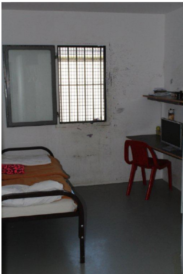
IMAGE 4. CELLULE EN ETABLISSEMENT PENITENTIAIRE POUR MINEURS