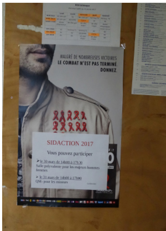
IMAGE 10. AFFICHAGE DU SIDACTION

En prison, lorsque nous les avons fait parler des séances d'informations ou de préventions dont ils ont pu bénéficier, ils partagent l'idée que « beaucoup de jeunes étaient là pour rigoler », tout en précisant malgré tout que « ça leur a servi à quelque chose », par exemple ils et elles disent avoir appris des choses sur