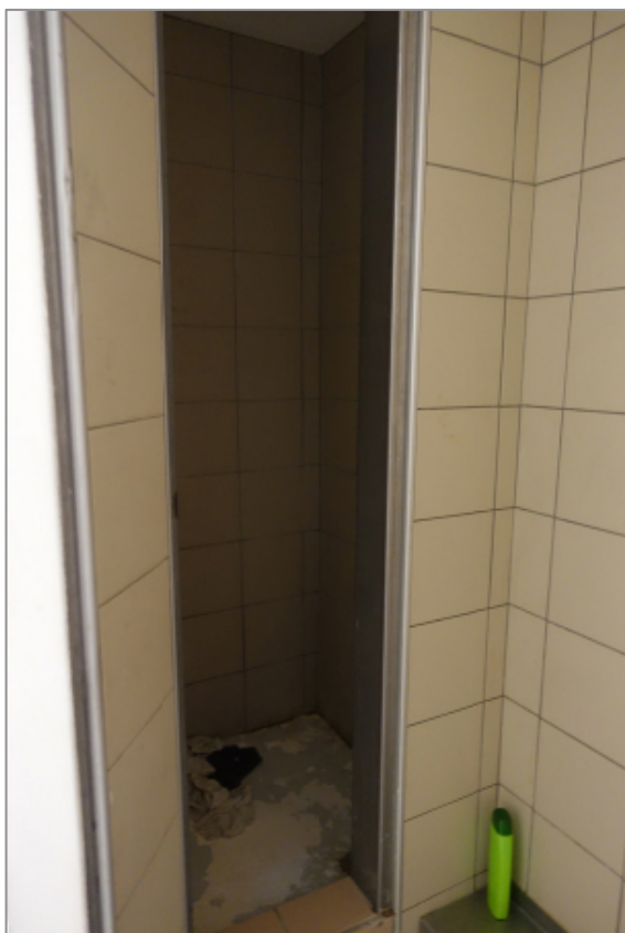
IMAGE 8. DOUCHE DANS UNE CELLULE EN ETABLISSEMENT PUBLIC POUR MINEURS

Au quotidien, il est clair que la propreté des cellules est aussi un grand enjeu de distinction entre détenus. Car si la « prison est sale », c'est surtout qu'« il y a des crades » parmi les détenus. Les critiques sont nombreuses à l'encontre des jeunes qui sont « sales », celui ou celle « qui se lave pas », « qui pue », et que les autres jeunes tiennent à l'écart : le fait d'être considéré comme « sale » va ensuite de pair soit avec l'image d'un « gamin », soit, pire, avec celle d'un « schlag », d'un drogué dépendant des médicaments administrés par les médecins de la prison.