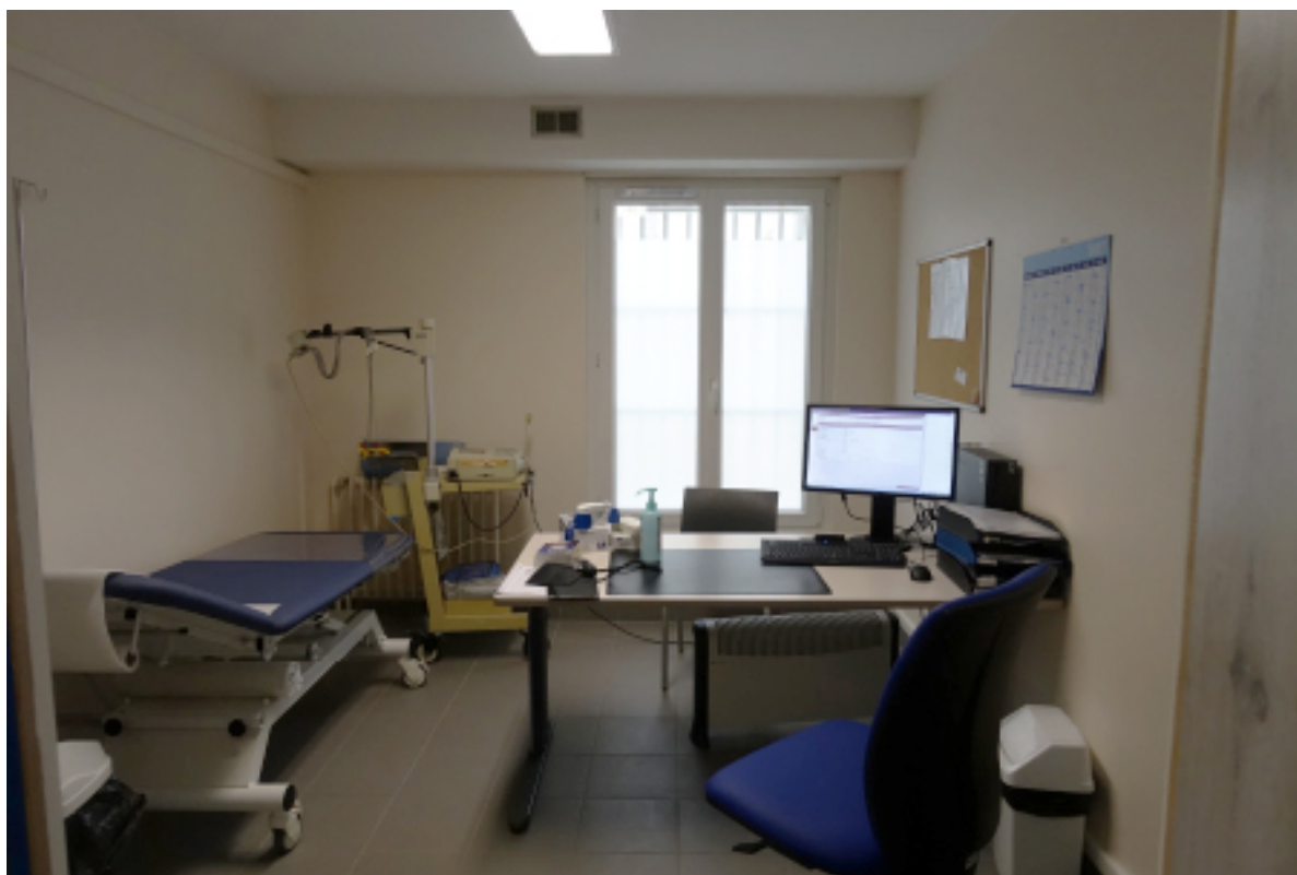
IMAGE 8. UNITE SANITAIRE, SALLE DE CONSULTATION