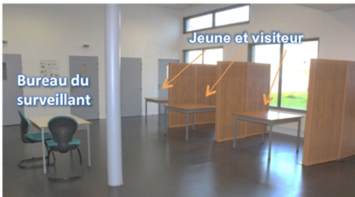
IMAGE 6. PARLOIR EN ETABLISSEMENT PENITENTIAIRE POUR MINEURS