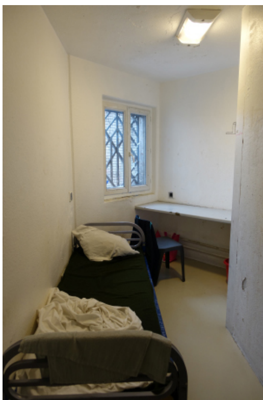
IMAGE 5. CELLULE EN MAISON D'ARRET

qui nous a rejoints lors de l'avant dernière cellule, fait également le lien entre les filles qui ne se respectent pas (notamment à travers leurs comportements sexuels