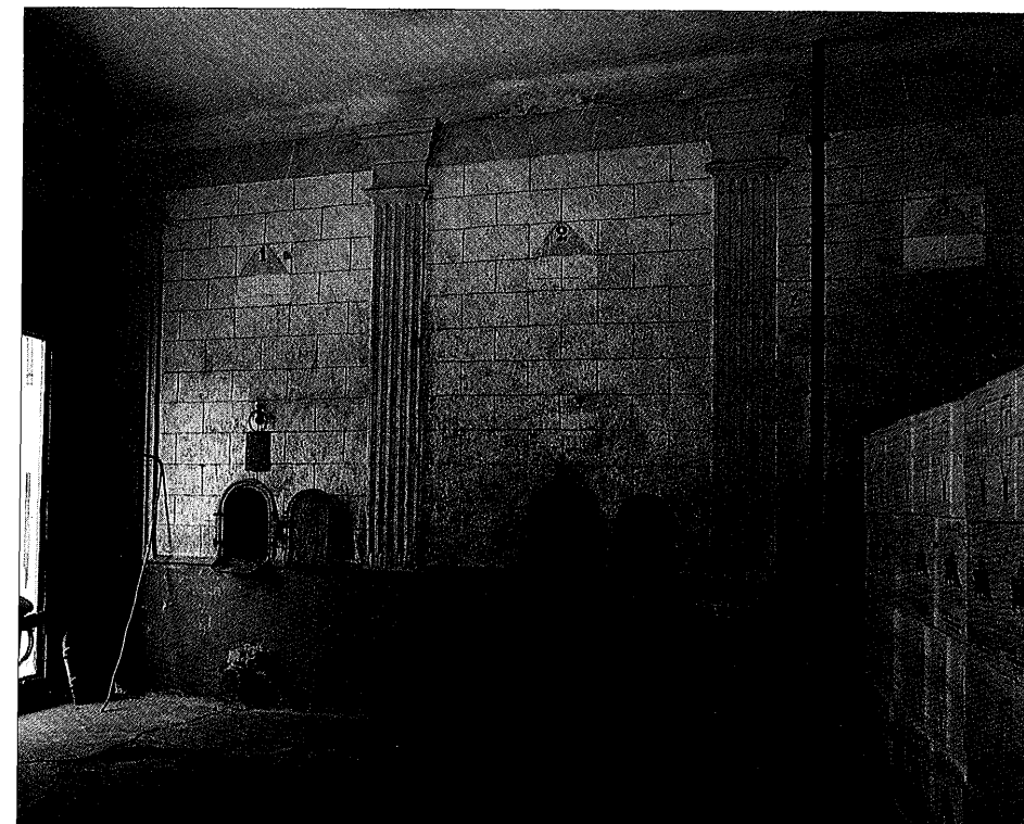
CAMPS-LA-SOURCE - Cave coopérative. 1906. Vue intérieure prise en 1991

On peut lire dans l'architecture et la distribution spatiale intérieure des coopératives l'expression de leurs fonctions sociales. A quelques exceptions près qui sont des réutilisations de bâtiments anciens convertis en caves comme à Cotignac ou Camps-la-Source, ou des extensions tardives de caves existantes comme à Carcès, elles forment, comme tous les bâtiments d'usage commun traditionnels, en