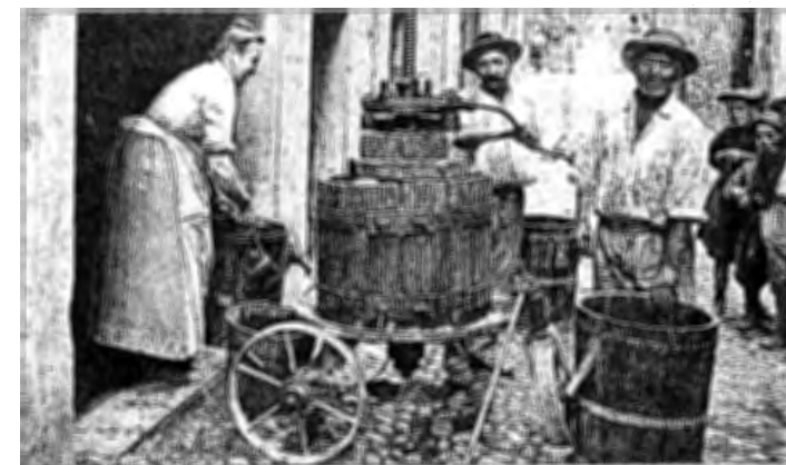
DRAGUIGNAN - Pressoir ambulant vers 1900. Carte postale.