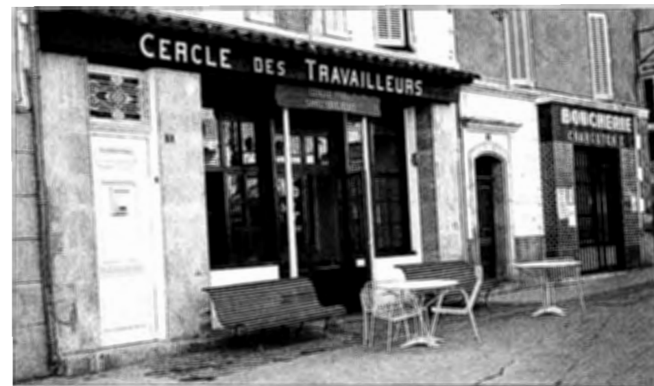
LA CADIÈRE D'AZUR - Le Cercle des Travailleurs. Vue prise en 1991.