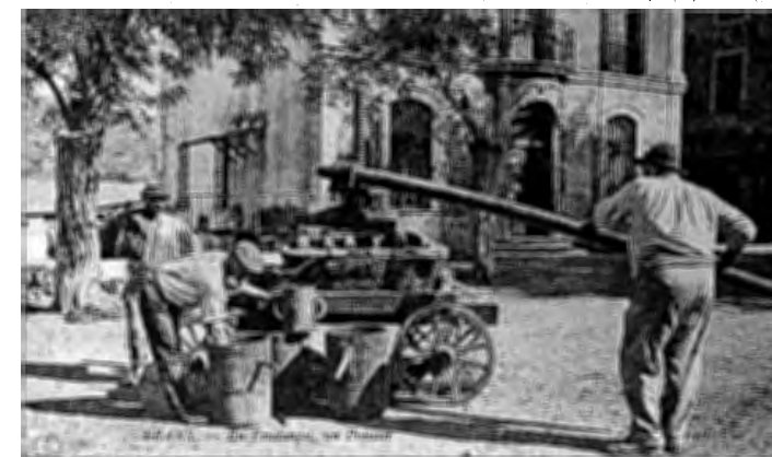
TRANS-EN-PROVENCE - Pressoir ambulant vers 1900. Carte postale. Musée ATP Draguignan.

Aussi, bien souvent, se passait-on de cette opération et il a fallu attendre le développement des coopératives pour qu’elle devienne courante. Selon le nombre de pressées subies, le marc pouvait encore avoir plusieurs utilisations : entre une et deux, il était confié au bouilleur de crû ( le faire-boui ) pour la production de l’eau de vie familiale, au-delà, il pouvait servir à l’alimentation des animaux en hiver. Quand ils ne nourrissaient pas la basse-cour, les pépins servaient éventuellement à faire de l’huile.