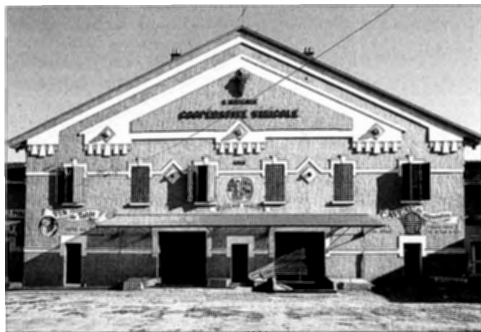
SAINT-MAXIMIN - L'Amicale. 1912. Vue prise en 1991.

Mais il y a mieux : à la périphérie de la Provence, dans les hautes vallées des Alpes-Maritimes, cette affinité entre cercles et coopératives va jusqu'à confondre les deux institutions. On trouve dans le pays de Contes des cercles qui produisent ou ont produit eux-mêmes leur vin. Ils recevaient les récoltes de raisin de