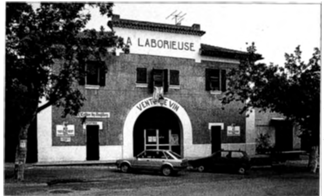
BRAS - La Laborieuse. 1923. Vue prise en 1989.