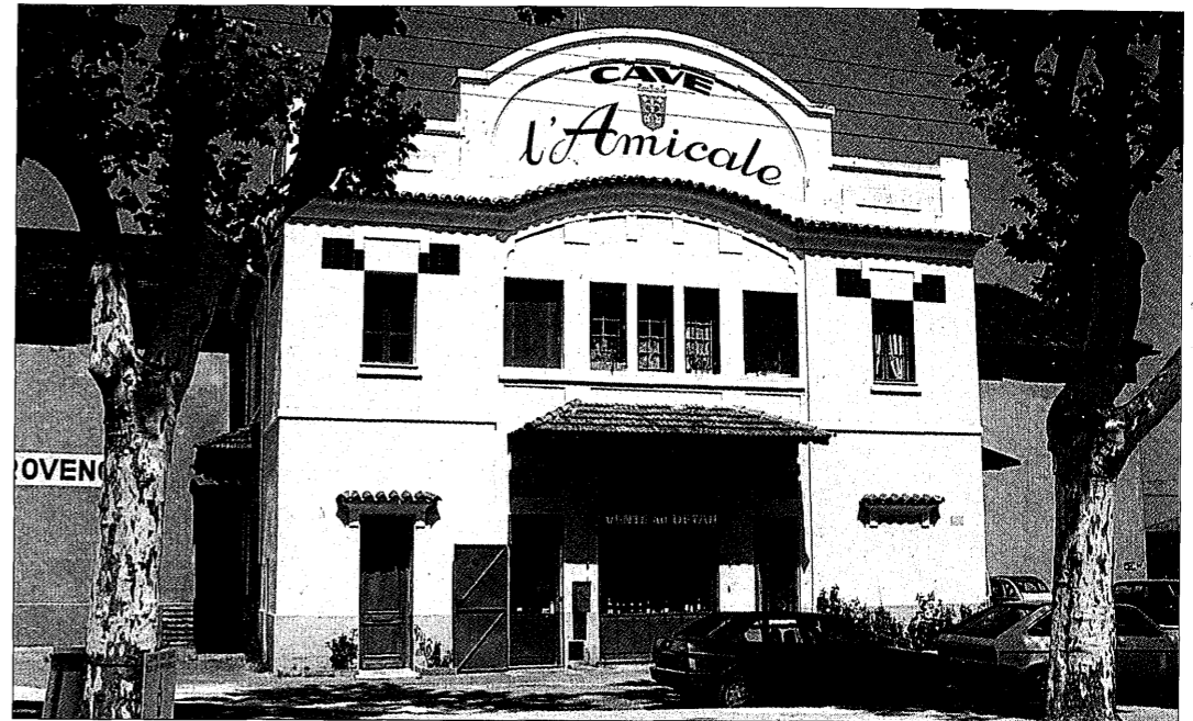
CUERS - L'Amicale. 1923. Vue prise en 1989.

Ces références exaltées dans les discours se lisent encore, en condensé, au travers des noms que leurs fondateurs leur ont donnés. Notons d'abord que "le nom, la date ainsi que la mention *coopérative vinicole* figurent pratiquement toujours en façade" (12). Rares sont les bâtiments d'usage technique villageois aussi manifestement désignés. Mais, au-delà du fait même de nommer, le choix des noms mérite atten-