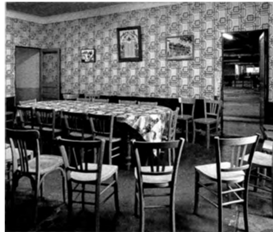
POURCIEUX - L'Union. 1912. Salle de réunion. Vue prise en 1991.

ses vins (bien que plus sûrement aujourd'hui livrés à l'appréciation des chalands dans les locaux de vente) figurent aussi au nombre de ces "papiers de famille". Actuellement, si les fonctions communautaires sont moins manifestement représentées et semblent s'effacer derrière une image professionnelle, la coopérative exprime toujours, à travers d'autres signes, l'identité villageoise. Avec les agrandissements et les innovations techniques auxquelles les caves se sont livrées, leur physionomie a certes beaucoup évolué mais la plupart d'entre elles ont