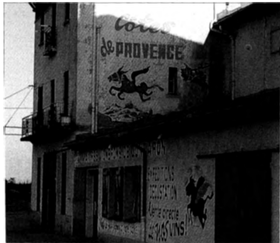
GONFARON - Les Maîtres Vignerons de Gonfaron. 1921. Détail de la façade. Vue prise en 1991.

sur un balcon dominant l'esplanade. Elle occupe dans la distribution de l'espace intérieur des caves une place importante. Plus importante même, du moins dans les plus anciennes d'entre elles, que celle du caviste "logé à l'étage dans les pièces construites entre les cuves" (13). Son décor évoque souvent les origines et l'histoire de la cave au travers des portraits des fondateurs, des personnages ou événements marquants qui ont jalonné son parcours. Les diplômes ou médailles qu'elle a obtenus pour la qualité de