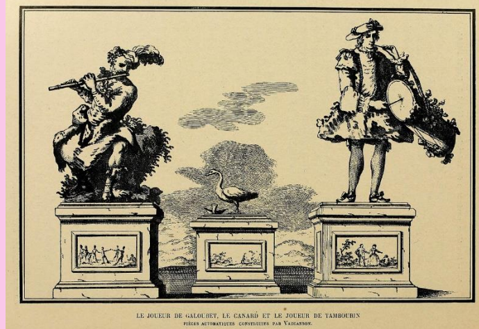
Les automates musiciens de Vaucanson (gravure du XVIII e s.)

1782), par ailleurs inventeur effectif de machines industrielles (tours métalliques, machines à tisser) : imaginer des créatures humaines va déjà de pair avec inventer les premières machines industrielles.