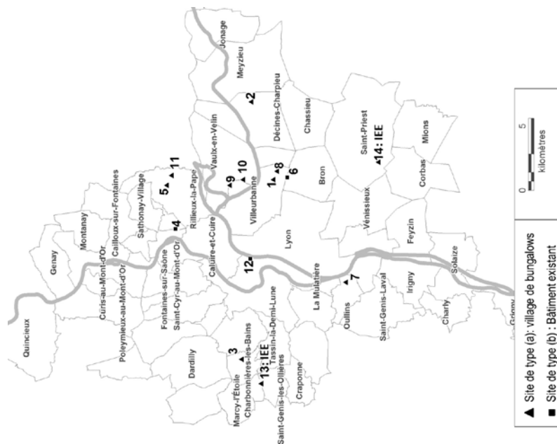
Figures 1 et 3 – Localisation des projets d'hébergement collectif pour familles étrangères dans l'agglomération lyonnaise et référencement selon la typologie du 1.2