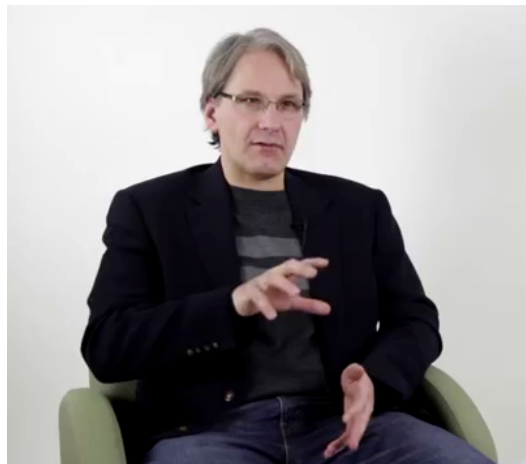
Figure 7 – FB « MD* c'était donc d'EXAMINER CES QUESTIONS-LA»

Un apport de précision (développement du noyau nominal) peut se traduire par un changement de plan ou d'orientation de la paume, souvent accompagné d'un changement