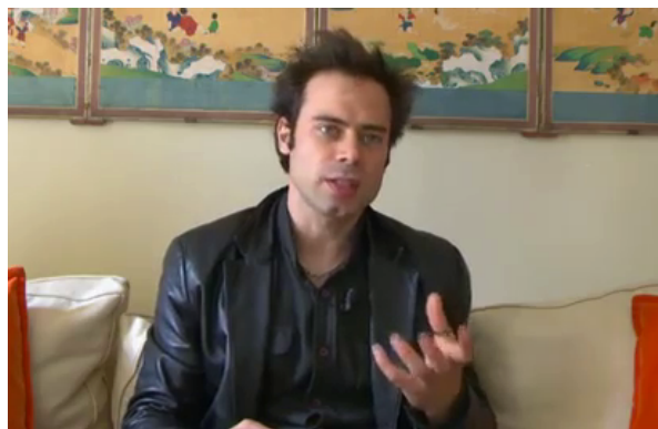
Figure 4– MC « MG* La mort qui est peut-être LE PLUS GRAND TABOU DE LA SOCIÉTÉ OCCIDENTALE » Cup of meaning - paume ouverte en supination

Le deuxième type de gestualité accomplissant des actes de réification et de référence nominales présente une homogénéité et une régularité moindres. Il s'agit d'une famille de mouvements principalement exécutés d'une main (MD/MG*), orientée dans le plan sagittal ou horizontal, en pronation ou en supination, paume (semi) ouverte, les doigts légèrement repliés pour effleurer, toucher ou retenir une masse, un objet virtuels. Nous n'en fournissons pas ici une analyse détaillée, faute de place, nous contentant de dégager des tendances générales. Lorsque la paume est ouverte en supination, dans le plan horizontal, et semble tenir en son creux du sens-substance, certains spécialistes (Müller 2004) parlent de « réceptacle du sens » ( cup of meaning ). Le geste inversé, en pronation, peut être appelé grip of meaning (notre suggestion). Les doigts agrippent de façon plus ou moins légère et inconsciente la « chose nominale » pour marquer une forme de contrôle et l'intégrer à diverses opérations. Ce que le GLOBE enveloppait est ici tenu de façon plus brève et énergique.