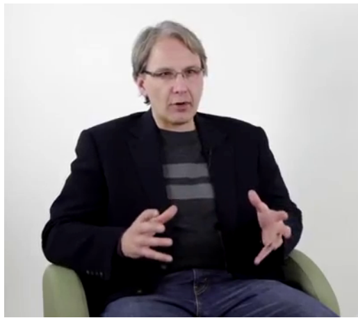
Figure 2 – FB « Donc ça fait UNE PROVINCE qui est devenue UNE PROVINCE PHARE DU CANADA » Globe élargi sur la seconde mention de « province »

époque à nous » ; «GL* CENTRE PUIS DEPLACEMENT LATERAL la peur du zombie est une peur du monstre évidente»).