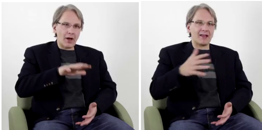
Figure 8 – FB « MD* on montre ce qu'est LA DROITE dans SA PREMIERE INCARNATION» Rotation de la main D accompagnant la complémentation prépositionnelle du N

d'inclinaison de la tête. C'est ici l'équivalent de « l'ouverture explicative » pratiquée avec le GLOBE: