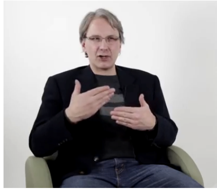
Figure 10 – FB « MG-MD* la RETRAITE DE RALPH KLEIN, LE PASSAGE A ED STELMACH et surtout L'ARRIVEE D'UNE NOUVELLE PREMIERE MINISTRE, ALISSON REDFORD »

Notons pour terminer que l'intervention simultanée des deux mains peut être réalisée de manière inverse, avec les paumes en creux et la pointe des doigts jointes, en pyramide. Le concept ou phénomène réifié et entifié est alors comprimé et écrasé . Placé à l'extrémité des doigts (et non plus dans ou sous la main), il est visuellement et grammaticalement focalisé (emploi de ce / cet ) :