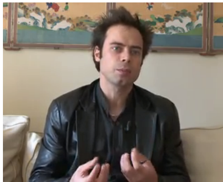
Figure 11 – MC « MG-MD* pourquoi CET EFFET, cette force de certaines images à séduire ? »

Notons pour terminer que l'intervention simultanée des deux mains peut être réalisée de manière inverse, avec les paumes en creux et la pointe des doigts jointes, en pyramide. Le concept ou phénomène réifié et entifié est alors comprimé et écrasé . Placé à l'extrémité des doigts (et non plus dans ou sous la main), il est visuellement et grammaticalement focalisé (emploi de ce / cet ) :