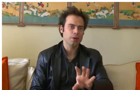
Figure 5– MC « MG* Donc regarder le cinéma de zombie c'est d'abord mettre en lumière LES GRANDES PEURS QUI ANIMENT L'OCCIDENT ACTUEL » Grip of meaning - paume ouverte en pronation