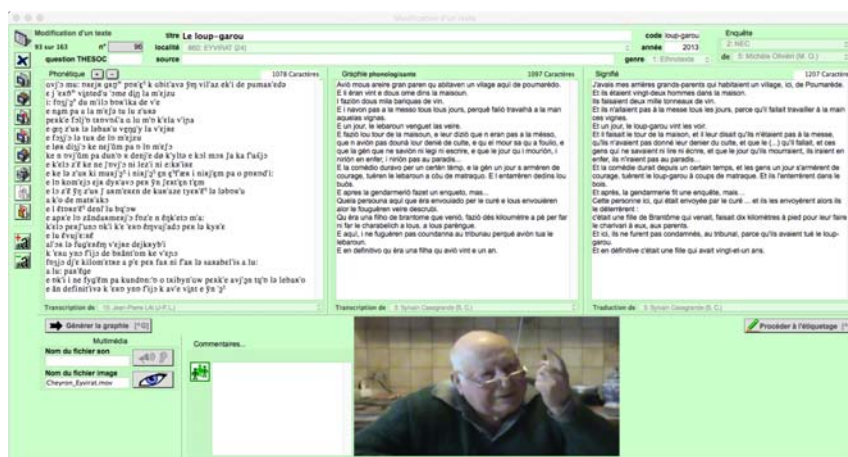
Figure 2. Un ethnotexte dans MMS.

Les autres textes, ‘oraux-écrits’, sont implémentés dans leur forme originale, le plus souvent dans une graphie mistralienne, mais certains dans d'autres systèmes graphiques, tels que la graphie italianisante dans le pays niçois ou la graphie alibertine en occitan central. MMS accepte donc toutes les graphies et les outils fournis dans la base gèrent toute cette variation, tout en conservant les particularités et l'originalité de chaque texte.