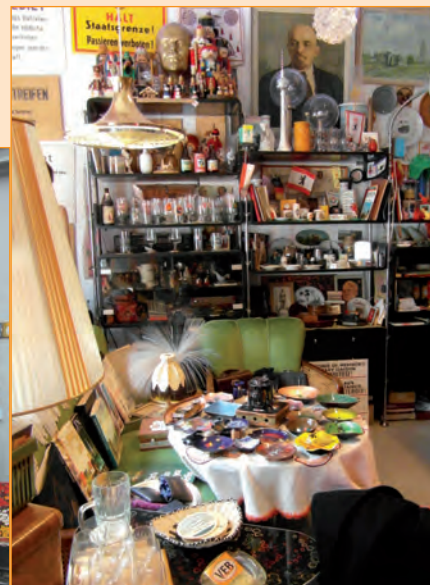
Photo 4/ VEBorange , l'intérieur du magasin. Cliché de M. Hocquet, février 2015.