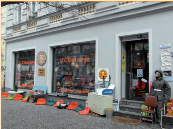
Photo 3/ VEBorange , l'extérieur du magasin. février 2015.