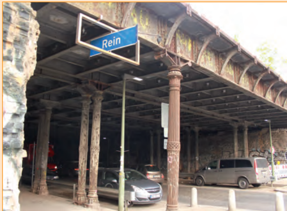
Photo 1 / Gleimtunnel et l'installation « Wind* », côté Est. Cliché de C. Garrido, avril 2017.

Le 13 août 1961 — Un autre dimanche deux sociétés pas vraiment distinctes se faisaient face. Mises à distance par des hommes et des fils barbelés, elles se regardaient à travers le tunnel. Un tunnel miroir, bientôt un tunnel écran, coupant de la réalité de l'autre côté. Un ici et un ailleurs allaient se former et se transformer, deux destins liés et parallèles se dessinaient. Le lieu prenait un sens nouveau. En quelques jours l'autre disparaissait, avec un ici et un ailleurs repoussés au-delà du Mur, et construits désormais dans l'imaginaire. Finis terrae (photo 2).