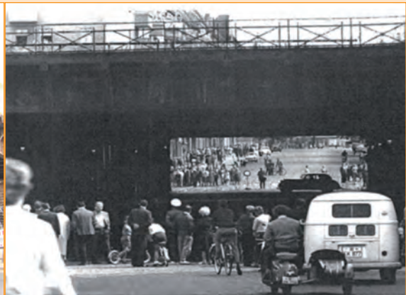
Photo 2 / Gleimtunnel, vu du côté Ouest. Source : Landesarchiv, Berlin, août 1961.