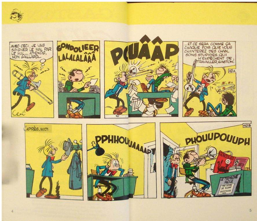
Franquin. Gala de Gaffes . Paris : J'ai Lu, « J'ai lu BD », 1987.