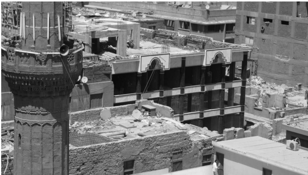
Figure 6. Un mall en construction. On remarquera que le style architectural de l'immeuble commercial diffère sensiblement du tissu urbain alentour, plus ancien.

Certains immeubles commerciaux ou résidentiels, voire des îlots entiers sont démolis, et les immeubles bas qui ne comptaient que quelques étages sont remplacés par des immeubles très modernes comptant parfois jusqu'à huit étages, en dépit des règles urbanistiques existantes. Leur style architectural est également différent du bâti plus ancien (voir figure 6) : les façades sont souvent en verre bleuté très clinquant, les matériaux choisis pour les sols et les murs sont luxueux, l'immeuble est parfois climatisé et on y trouve parfois des aménités à destination de la clientèle (toilettes, etc.).