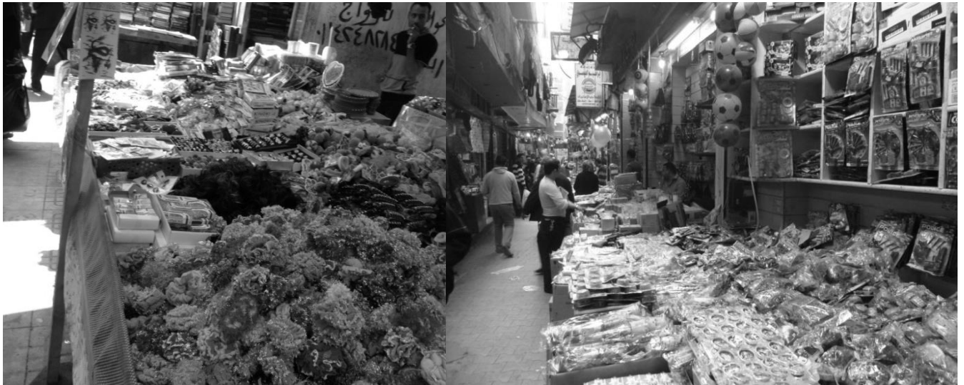
Figure 1. Quelques exemples de produits made in China vendus au Muski. Accessoires pour les cheveux, vêtements, bijoux fantaisie et chapelets à gauche, jouets à droite. Clichés A. Bouhali, mars 2012 et juin 2013.

Ces produits sont bien souvent de qualité médiocre mais ils répondent pourtant à une demande croissante des consommateurs (De Coster, ibid. ). Ces flux de marchandises, visibles dans tous les marchés du pays, ruraux et urbains, petits et grands, et dans toutes les rues via les marchands ambulants, sont difficiles à quantifier. Cette mondialisation non hégémonique est difficile à évaluer car elle ne peut pas être mesurée grâce à des statistiques étant donné qu'il n'existe pas de telles statistiques (Mathews et Alba Vega, 2012). En effet, une partie de ces marchandises, comme nous l'avons noté pendant nos enquêtes, n'est pas déclarée. La fraude se fait au moment de l'entrée de la marchandise dans le pays au niveau des douanes (sous-déclaration du volume total d'importation, corruption des douaniers pour éviter des redressements trop coûteux), ou encore lors de la facturation, que ce soit en Chine ou en Egypte.