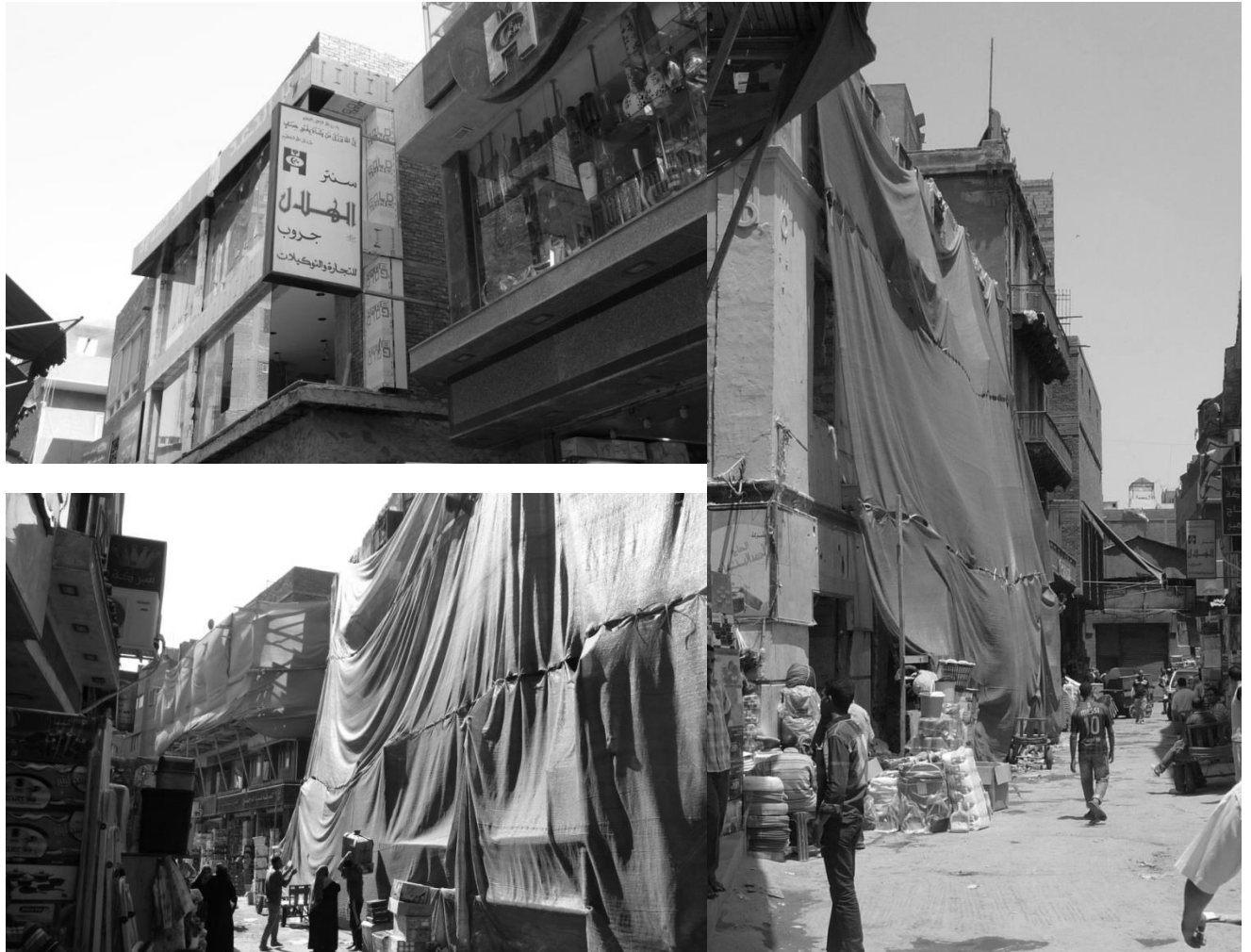
Figure 7. La harat al-Sarbakis, nouveau centre commercial du petit électroménager. Cliché en haut à gauche : les vitrines des nouveaux centres commerciaux. Cliché en bas à gauche : les centres commerciaux en construction viennent remplacer les immeubles résidentiels. Cliché à droite : derrière la bâche, un immeuble résidentiel très récemment tombé en ruines au premier plan, et, à l'arrière-plan, le dernier immeuble résidentiel encore debout, les dernières traces de l'ancienne fonction résidentielle de la rue. Clichés A. Boubali, juillet 2013.

Les mutations paysagères gagnent donc des ruelles entières, jusque-là épargnées, comme c'est le cas par exemple de la harat al-Sarbakis, petite ruelle située au sud de la rue al-Azhar. Cette ruelle est devenue en moins de cinq ans une annexe du quartier spécialisé originellement dans le petit électroménager, Hammam al-Talat, situé de l'autre côté de la rue al-Azhar. Le quartier du Hammam al-Talat étant devenu trop exigü, les commerçants qui y possédaient déjà un magasin voire un immeuble entier ont progressivement racheté les vieux immeubles résidentiels de la harat al-Sarbakis, et en ont détruit la plupart avant d'y construire de nouveaux centres commerciaux.