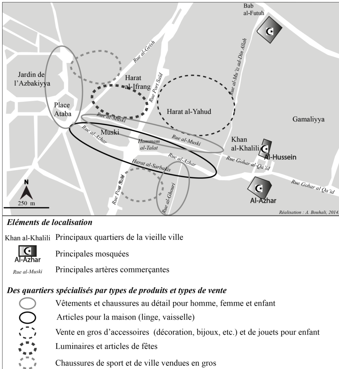
Figure 4. Le Muski, un marché à l'organisation traditionnelle.

Cette organisation n'est pas remise en cause dans son principe par la diffusion massive des produits made in China , mais on observe des changements dans le temps en ce qui concerne les produits vendus. Les commerçants se sont adaptés aux goûts des consommateurs, mais aussi aux changements de prix de certains produits, les produits made in China étant bien souvent moins chers que les produits égyptiens. Ces changements de spécialisation à l'échelle infra locale se sont opérés en quelques années seulement, comme on peut le voir en comparant nos relevés et ceux réalisés antérieurement par des géographes ou des historiens. David (1999), Madœuf (1997 ; Madœuf et al. , 1999) et Salin (2004) ont en effet étudié très finement la spécialisation des rues et