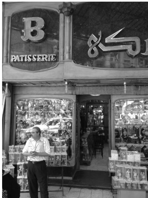
Figure 5. Une ancienne pâtisserie de la rue al-Geish, aujourd'hui spécialisée dans la vente de produits de fête. Cliché A. Bouhali, juin 2013.

Nous donnerons ici comme exemple une petite portion du quartier, délimitée à l'ouest par la rue al-Geish, au sud par la rue du Muski et à l'est par la rue Port-Saïd. Encore spécialisées à la fin des années 1990 dans la pâtisserie à l'occasion des mariages et naissances, les boutiques de ce sous-district du Muski vendent aujourd'hui soit des lampes dont la plupart viennent de Chine, bien souvent achetées à l'occasion des mariages pour décorer le logement du couple, soit de petites figurines, offertes par les couples de jeunes parents à la famille et aux amis venus voir le nouveau-né. Cette mutation est particulièrement visible grâce au fait que les devantures sont restées exactement les mêmes. Il est intéressant de noter que, en dépit de ce passage d'une activité d'artisanat à une activité de service, les commerçants sont néanmoins restés dans le secteur du mariage et des naissances, mais cette fois-ci en lien avec les produits d'importation.