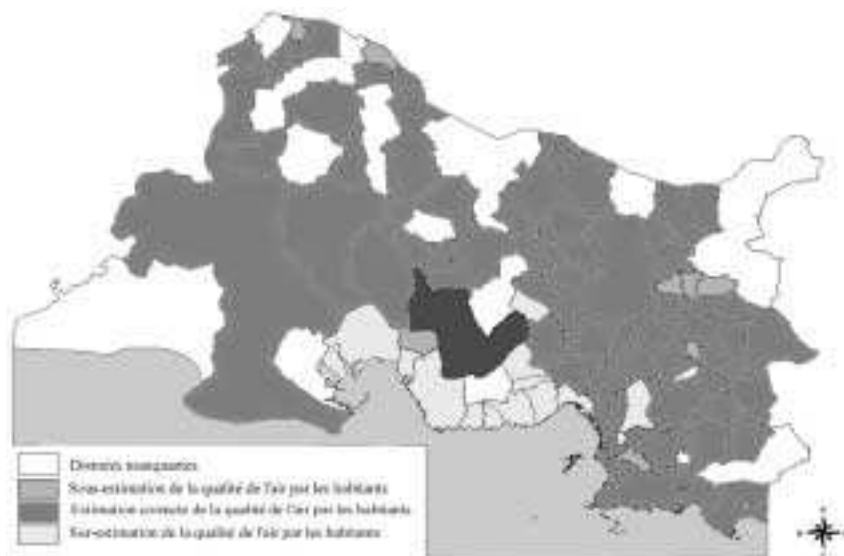
Figure 2. Écart entre qualité de l'air mesurée et qualité de l'air perçue par les habitants des communes du département*

* Les données manquantes indiquent une absence de répondants dans cette commune.