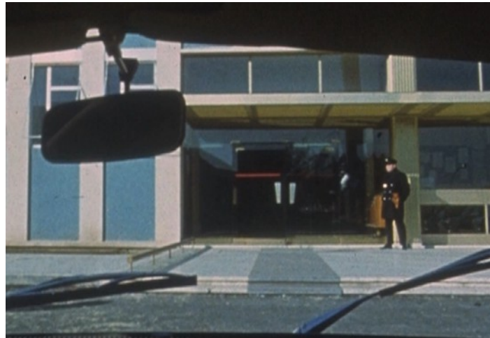
Image 21. Garde armé à l'entrée du réacteur Rapsodie de Cadarache, servant d'image extérieure au bâtiment de travail des chercheurs du feuilleton Extrait du feuilleton Les Atomistes