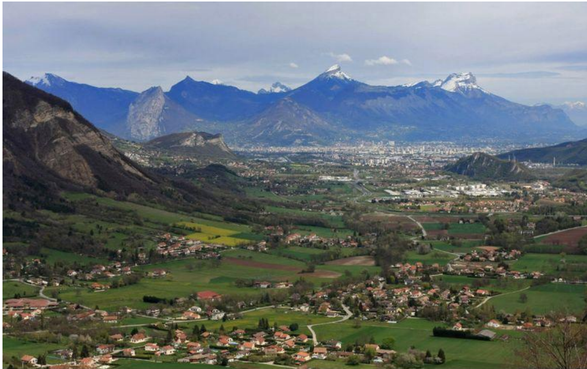
La plaine de Bièvre, au pied du massif du Vercors et de la Chartreuse. Au premier plan Saint-Paul-de-Varces, puis Varces, ensuite Grenoble ; en arrière-plan le massif de la Chartreuse[3] .