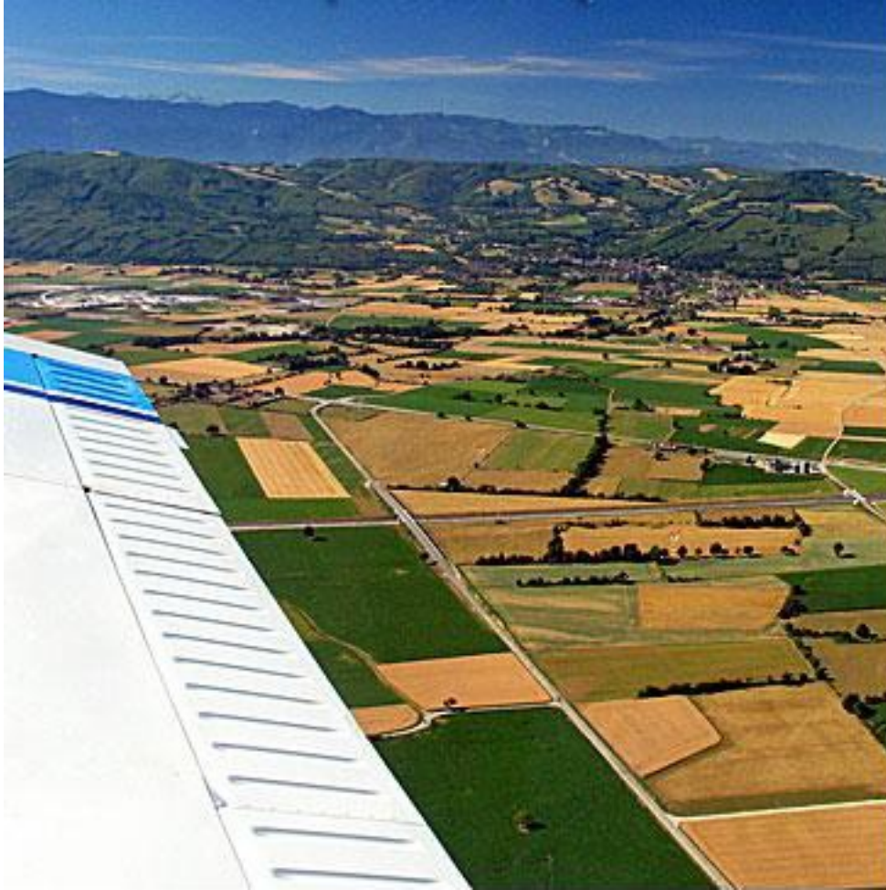
Le paysage d'openfield constitué par l'agriculture périurbaine de l'agglomération grenobloise[4] .