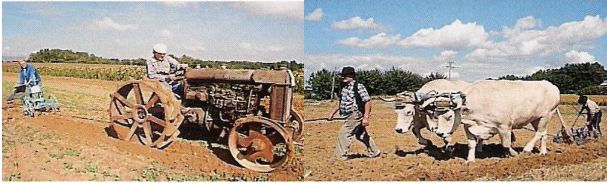
Ci-dessus, à gauche : Tracteur FORDSON de 1925, tractant un brabant À droite : Paire de bœufs tractant un canadien (le jour de la fête annuelle, août 2011)