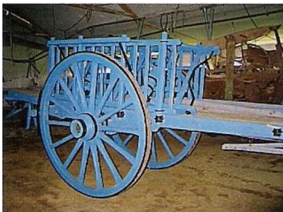
Charrette d'époque, jamais servie, retrouvée par les membres de l'APER

Pour contacter les Amis du Patrimoine Étoilien et de la Ruralité : Quartier de la Croix – 26800 Étoile-sur-Rhône. Tél. : 04 75 55 61 88. Site internet : www.amisdupatrimoine-aper.net