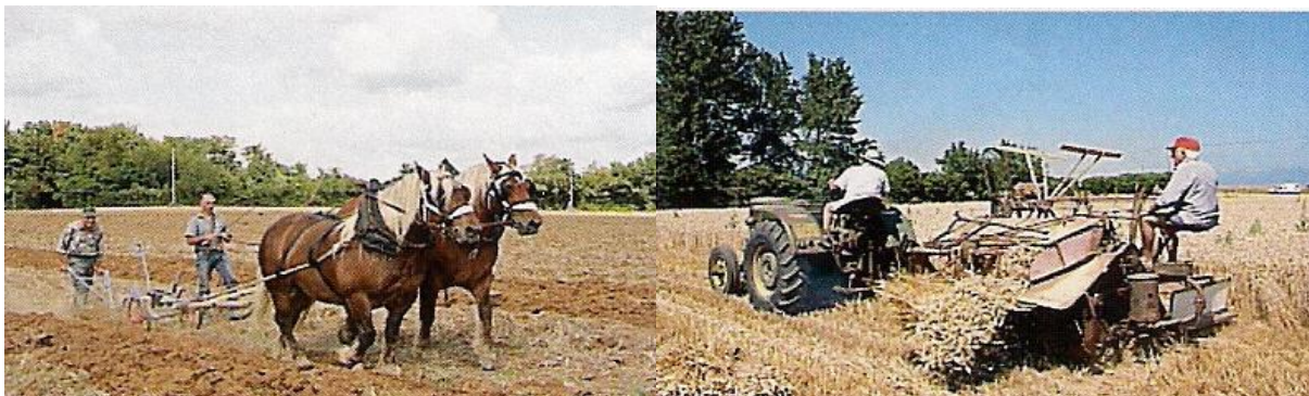
Ci-dessus, à gauche : Paire de chevaux tractant une charrue (le jour de la fête annuelle, août 2011) À droite : Moissonneuse-lieuse tractée par un tracteur Mc CORMICK des années 1950, lors de la fête des moissons