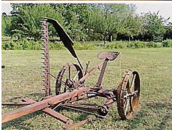
Faucheuse à traction animale