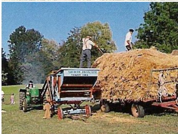
Batteuse, lors d'une fête des battages, actionnée par un tracteur VIERZON des années 1950