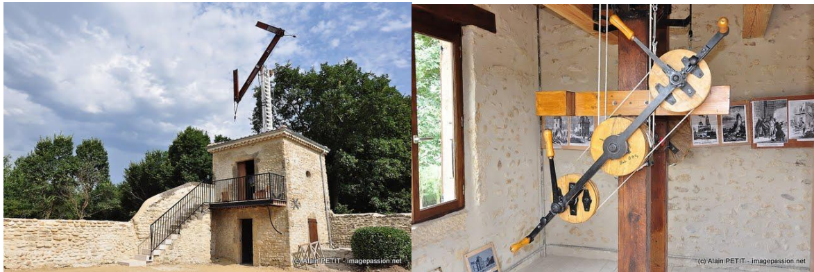
Le télégraphe Chappe réhabilité par l'APER, datant de l'époque Napoléonienne

L'association participe aux journées du patrimoine, à des plantations de vignes et au conservatoire des vieux cépages, à des fêtes diverses sur la demande des communes, à des réunions, à la réalisation d'un livre sur le patrimoine étoilien, à des prêts et échanges de matériels anciens, confection et usinage de pièces, séjour d'échange et de développement culturel avec la Roumanie.